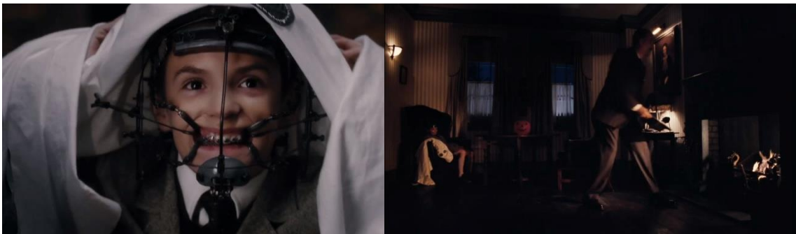
Fig. 14. Willy Wonka de neno celebrando Halloween (min. 57:19) e momento no que o seu pai tira cos doces á cheminea (min. 58:50).