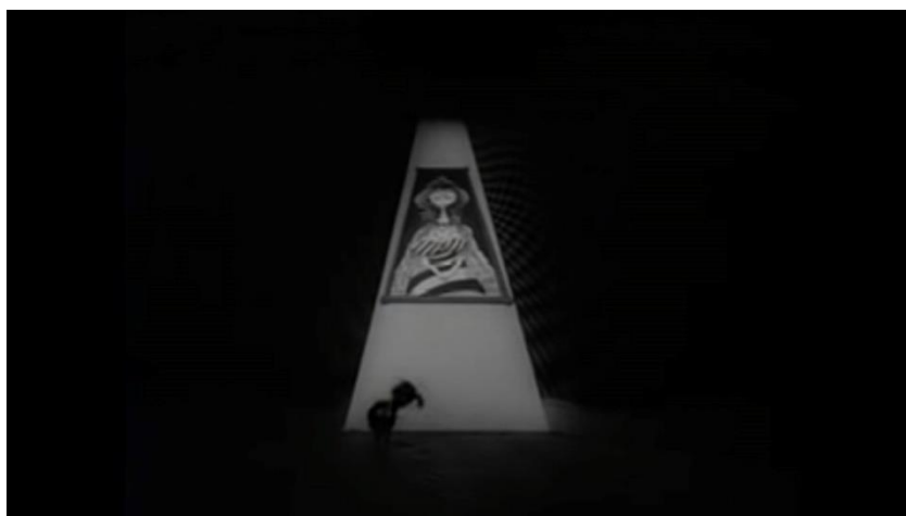
Fig. 15. Retrato dunha muller que aparece en Vincent (min. 3:04).