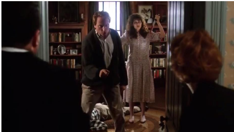
Fig. 12. Escena de Bitelchús onde se atopan a parella morta e os novos inquilinos (min. 17:43).