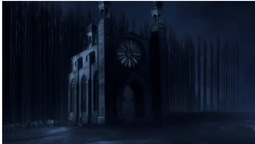
Fig. 4. Igrexa de La Novia Cadáver (min. 18:21).