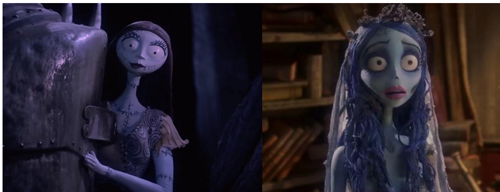
Fig. 20. Sally ( Pesadilla Antes de Navidad , min. 1:08:07) e Emily ( La Novia Cadáver , min. 39:22).