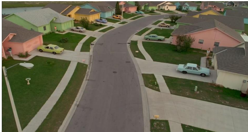
Fig. 2. Barrio residencial de Eduardo Manostijeras (min. 26:38).