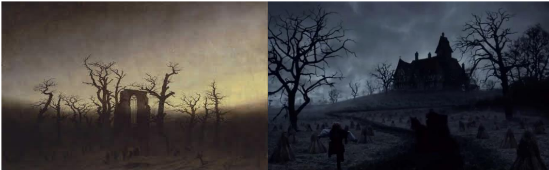
Fig. 5. Comparativa de Abadía no Carballal (1809-1810) e Sleepy Hollow (min. 1:24:34).