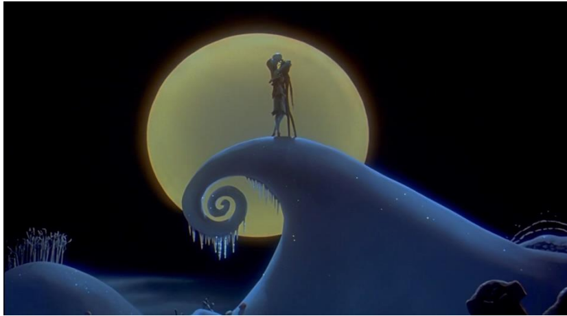
Fig. 1. Escena de Jack e Sally no cemiterio en Pesadilla Antes de Navidad (min. 1:11:34).