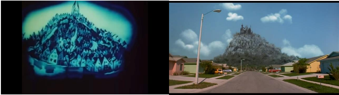
Fig. 10. Comparativa da cidade do Dr. Caligari (min. 4:05) coa colina na que vive Eduardo Manostijeras (min. 8:30).