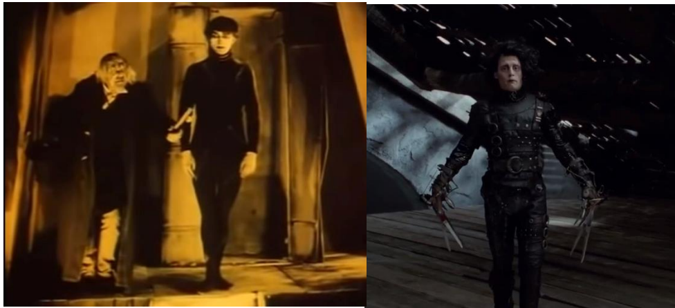
Fig. 8. Comparativa entre Cesare (min. 19:10) e Eduardo Manostijeras (min. 13:50).