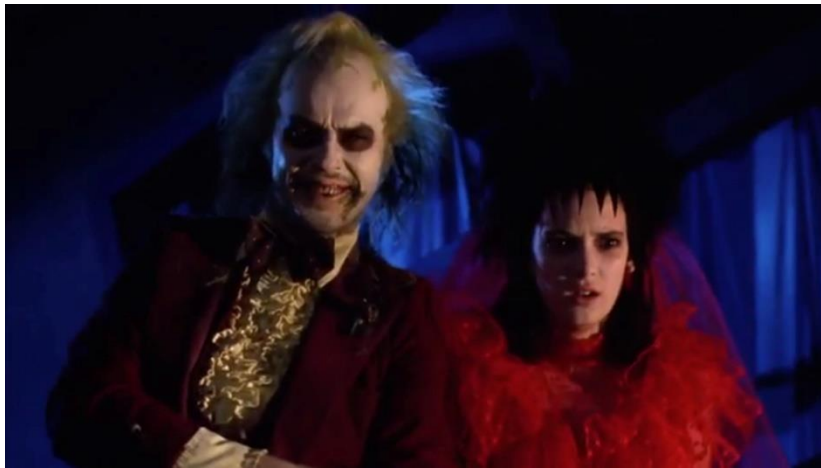
Fig. 11. Mostra da estética kitsch que conforma o filme de Bitelchús (min. 1:22:05).