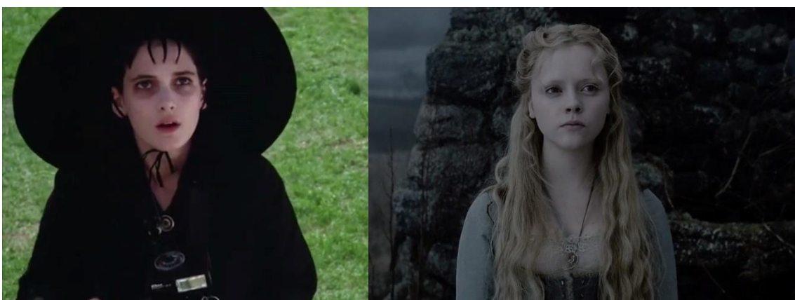
Fig. 6. Comparativa de Lydia Deetz (personaxe que segue a moda gótica, Bitelchús , min. 24:09) e de Katrina van Tassel (personaxe de contraste, Sleepy Hollow , min. 1:11:57).