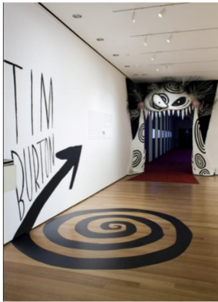
Fig. 22. Instalación da exposición Tim Burton do MoMA.