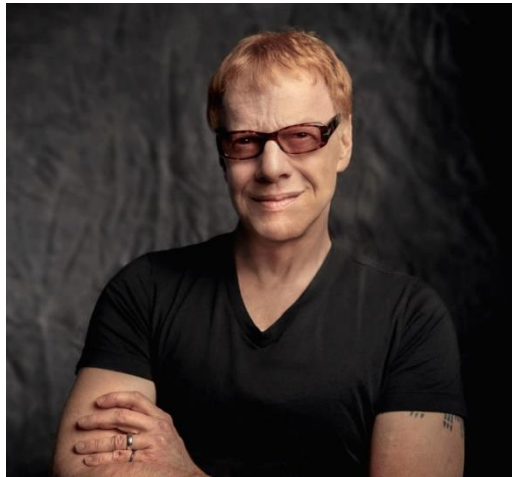
Fig. 17. Imaxe de Danny Elfman.