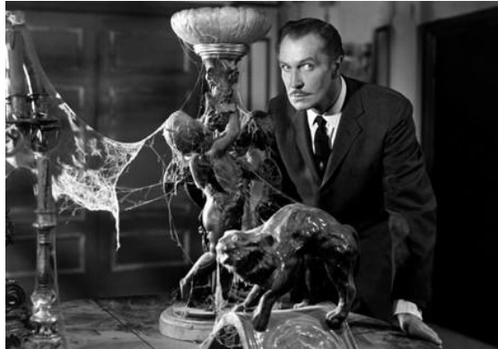
Fig. 16. Imaxe de Vicent Price.