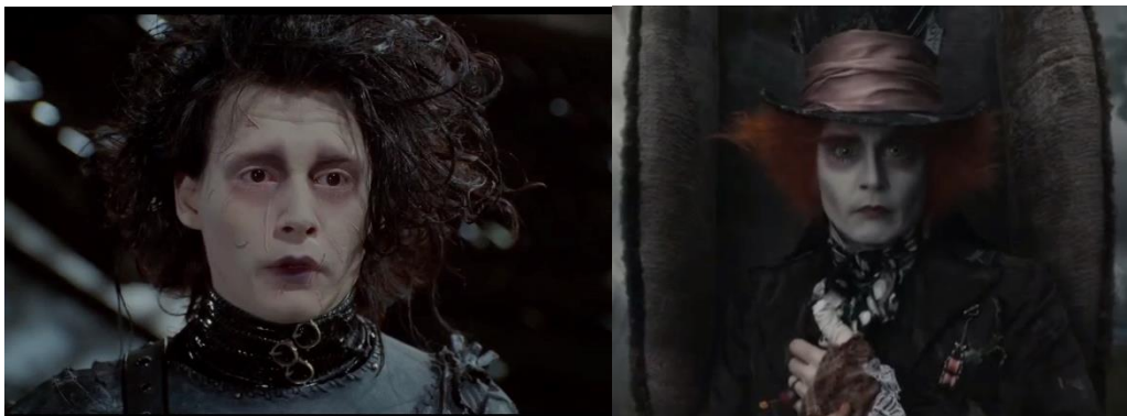
Fig. 21. Johnny Depp como Eduardo Manostijeras (esquerda, min. 14:39) e Sombbrero Loco (dereita, min. 30:55). Exemplo da súa expresión coa mirada.