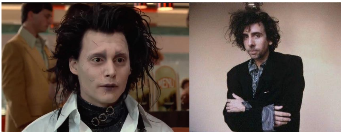
Fig. 3. Comparativa de Eduardo Manostijeras (min. 1:00:30) e Tim Burton.