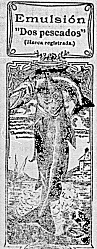
La que en menos tiempo alcanzo más popularidad y estimación de la clase médica y obtuvo más medallas de oro.—Dr. Doyen.