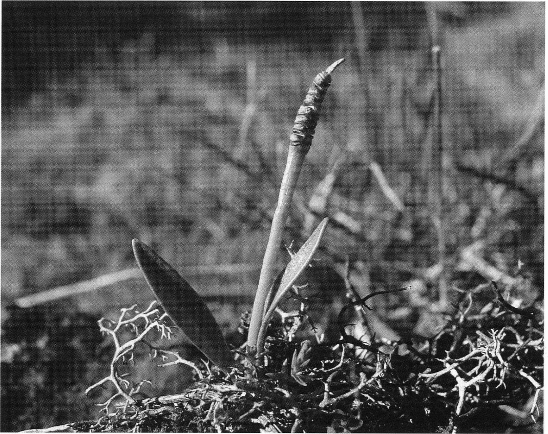
Fig. 2. Ophioglossum lusitanicum .