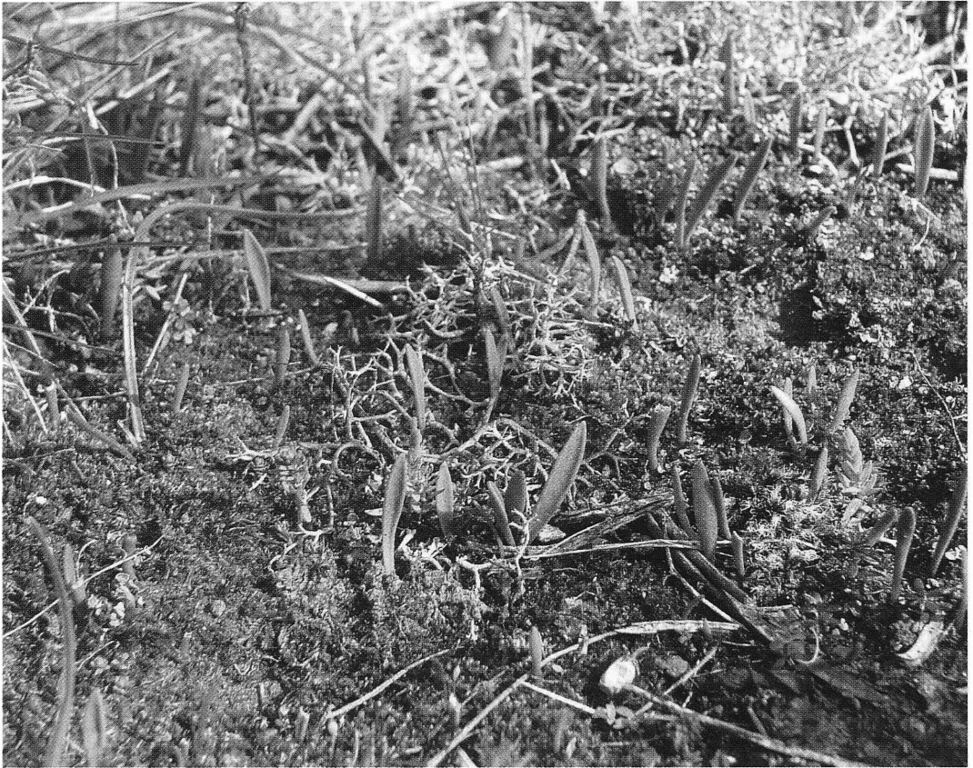
Fig. 1. Asociación Pleuridio acuminati-Ophioglossum lusitanici .

diversa e interesante desde el punto de vista de su conservación, constituida por un elevado número de briófitos y con la presencia de Ophioglossum lusitanicum (Fig. 1). Esta comunidad habita preferentemente sobre los suelos poco profundos y sólo la hemos observado en el área meridional de dicho afloramiento.