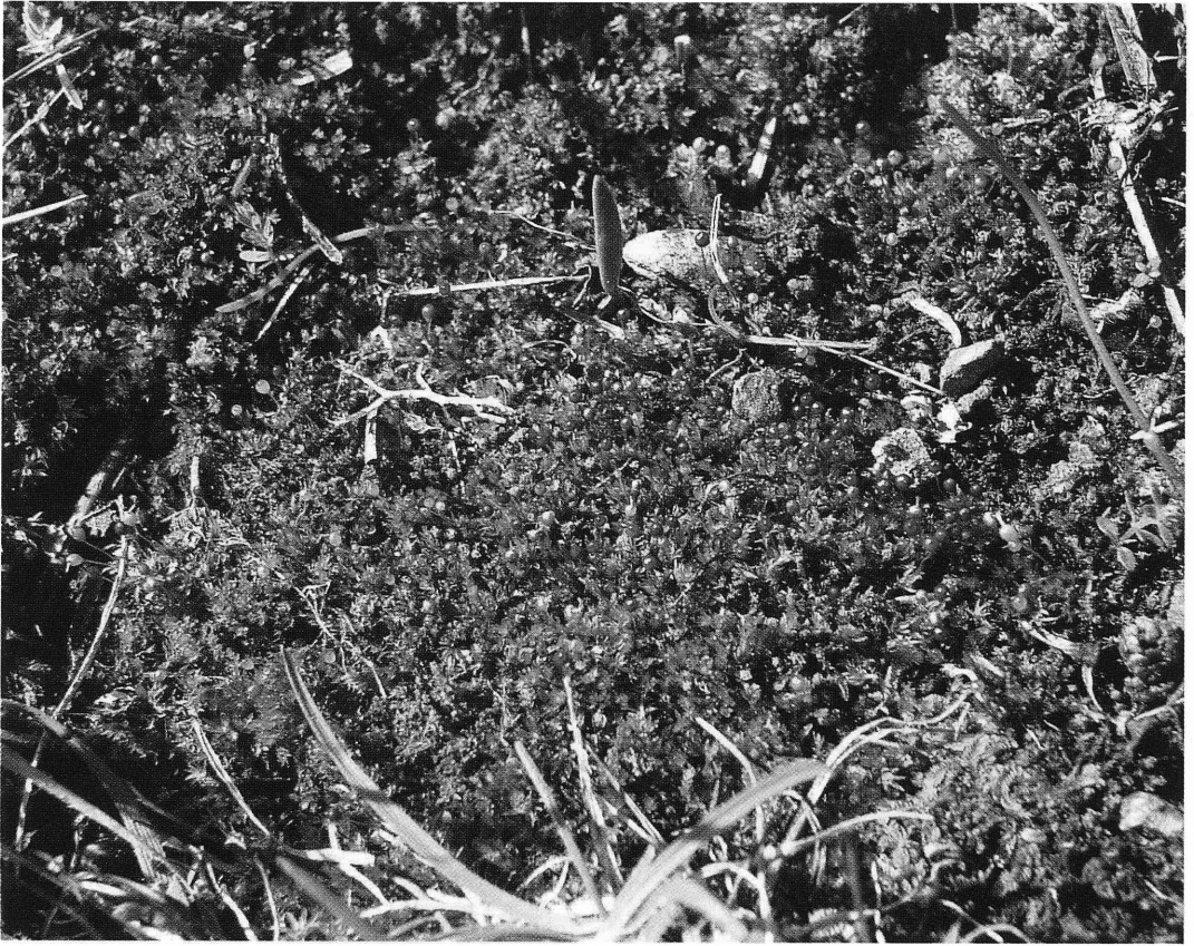
Fig. 3. Detalle de la comunidad destacando los esporófitos de Entosthodon sp. pl.

Cicendion (Rivas Goday & Borja 1961) Br.-Bl. 1967: Isoetes hystrix , Cicendia filiformis , Exaculum pusillum , etc.