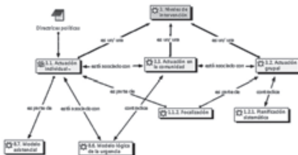
Gráfico 4. Ejemplo del análisis de los niveles de intervención socioeducativa (caso 2)

“Tenemos claro que en un momento como este a la gente no se le puede decir ‘no, espérese, que vamos a hacer ahora aquí un proyecto fantástico donde toda su situación la vamos a contemplar’” (E28: 28:61).