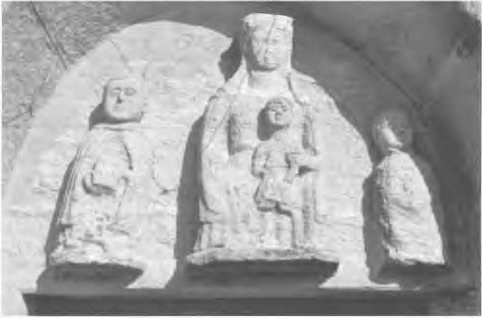
Fig. 3: Tímpano de la capilla de santa María de Chanteiro (Ares)

dental tal vez se elevase la portada con el tímpano de la Virgen María con el Niño flanqueados por dos franciscanos, integrado actualmente en la modificación de la fachada del siglo XVII 42 .