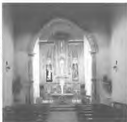
Fig.4 a) Templo de S. Catalina de Montefaro. Fig. 4 b) Templo de S. María de Valdeflores.

El interior del templo se concebía como espacio sagrado polivalente. La posibilidad de administrar todos los sacramentos y el encargo del rezo de los oficios divinos a los frailes obligaba a la existencia del coro de frailes en la capilla mayor y su entorno, elevación de altares para el culto de devociones diversas – poner altares en la iglesia de dicho monestereo e en cada una delas capielas del en que canten e celebren misas los frayres – que parecía distanciarse de las recomendación de san Francisco a sus hermanos de celebrar una única misa al día 75 .