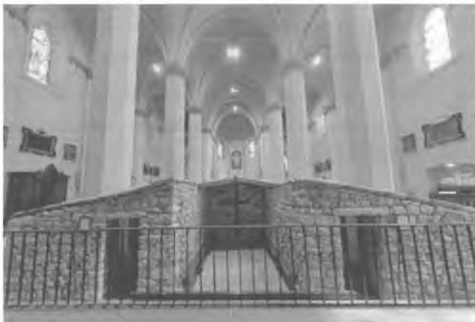
Fig. 2. Tugurio de Rivortorto.

nada de lo que se construye para ellos, si no son como conviene a la santa pobreza que prometimos en la Regla, hospedándose siempre allí como forasteros y peregrinos» 34 .