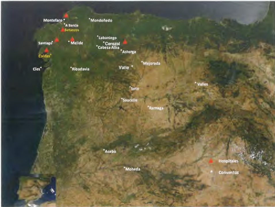
Fig. 1. Conventos y hospitales terciarios en el noroeste hispánico

En otras comunidades, la actividad de los frailes de oración y penitencia, se combina con la atención pastoral a los fieles y con la asistencia a los necesitados. La dedicación pastoral se resalta en los Breves a través de abundantes menciones a la celebración de los oficios divinos en sus capillas e iglesias, misas, funerales, enterramientos y también al cuidado de la ortodoxia ante posibles desviaciones heréticas. La labor asistencial a pobres, enfermos y peregrinos en los hospitales, permite a los frailes proporcionar un auxilium material (calor, cama y comida) y una contribución espiritual, que tiene lugar en un espacio sagrado dispuesto a veces en un sencillo altar en la reducida estancia, o bien en capillas o iglesias adyacentes.