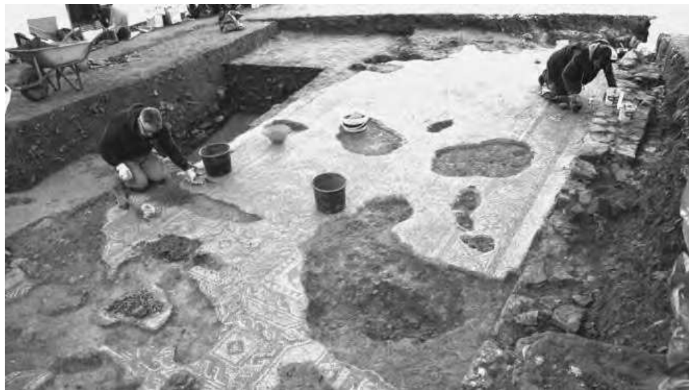
Fig. 3 – Vista de los trabajos desarrollados en la villa de Andayón durante el año 2020

mientras que durante el 2020, ya en plena pandemia, ha sido de 490 19 . No cabe duda, por tanto, de que realizando actividades de investigación en este tipo de yacimientos, y llevando a cabo un plan integral de difusión y divulgación de los resultados de los trabajos, estos se convierten en un referente en la zona en la que se ubican, propiciando el desplazamiento de visitantes y el desarrollo de los núcleos colindantes.