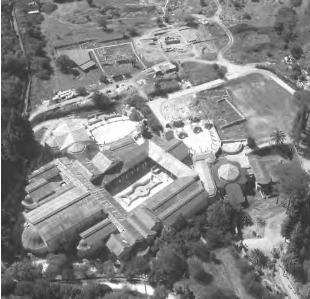
Fig. 1 – Vista aérea de la villa del Casale de Piazza Armerina

vida cotidiana. En este sentido se da una situación similar, salvando las distancias, a la que se daba en la sociedad durante la época tardorromana, pues ya los autores del período señalaban la necesidad de alejarse de la urbe y disfrutar de las comodidades y la tranquilidad que se disfrutaba en el campo.