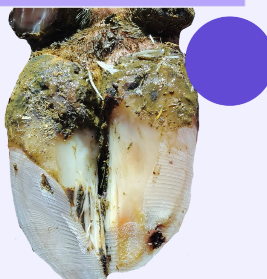
Enfermedad línea blanca