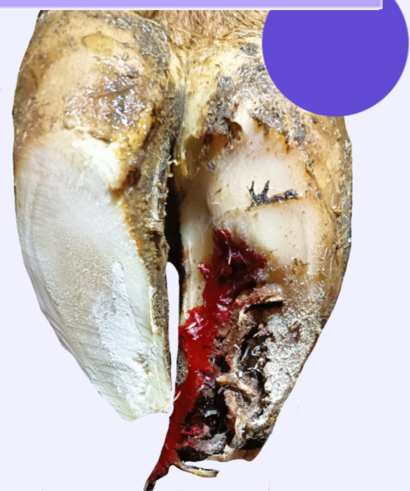
Necrosis de la pezuña