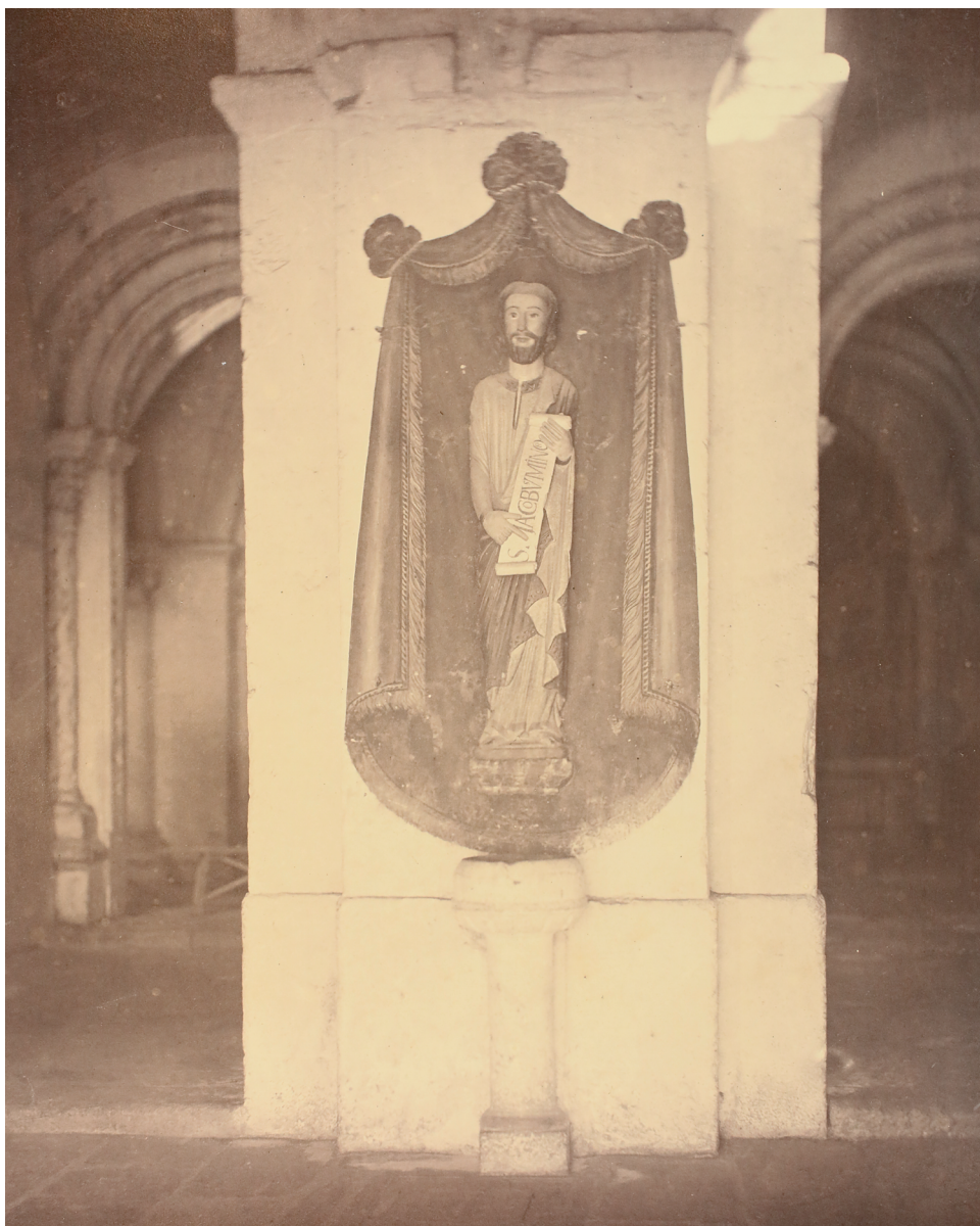
Fig. 3 Medieval image of St James Alpheus (St James the Lesser) displayed in the crypt, 1866

parishes 31 . The document of the latter petition justifies the interest in the crypt for its proximity to the apostolic mausoleum: “(...) because they are in such a sacred space and so close to the floor level where the holy body of Lord St James the Greater is found.” 32