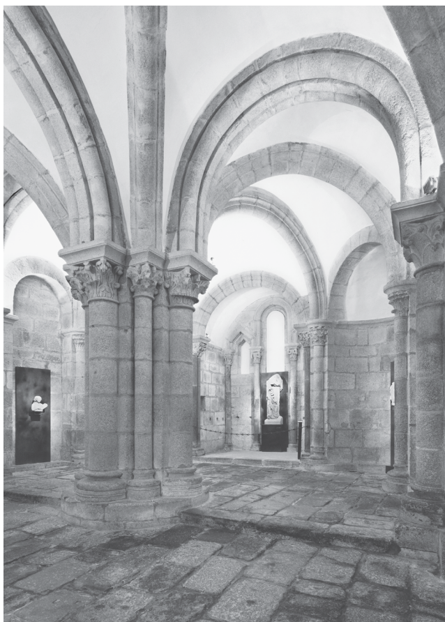
Fig. 1 Crypt of the Pórtico de la Gloria

the hall that welcomed the faithful who entered from the outside front entrance 11 from an unknown date until 2017 12 (fig. 3). Its presence might be related to the introduction of his cult in the cathedral by Archbishop Berenguel de Landoira (1317–1330), a prelate to whom we owe the bust-reliquary of the head of this apostle and the custom of exhibiting it in processions of the Chapter. 13 So, it would be possible to date this dedication of the crypt to St James Alphaeus from his prelature.