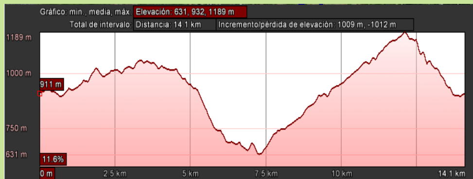
GRÁFICO DO PERFIL DE ELEVACIÓN E DISTANCIA