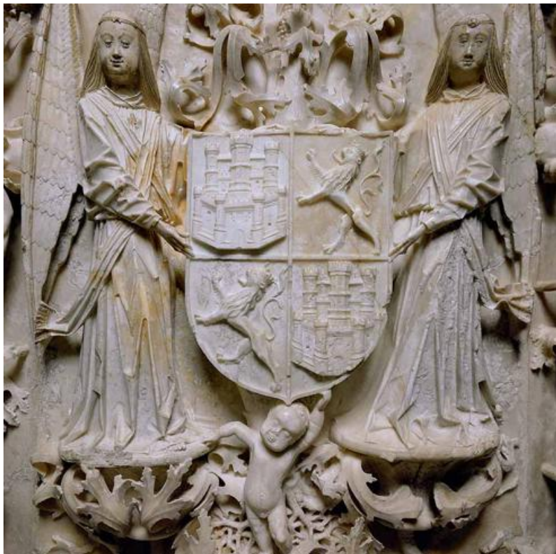
Fig. 5. Imagen en detalle de la parte frontal del sepulcro. Representación de la heráldica sujeta por dos ángeles. Extraído de: Fundación Iberdrola, La cartuja de Miraflores I: los sepulcros , Cuadernos de restauración de Iberdrola XIII, Madrid, 2007, p. 69.