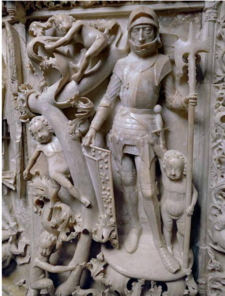
Fig. 6. Imagen en detalle del guerrero con sus armas situado en la parte frontal del sepulcro.