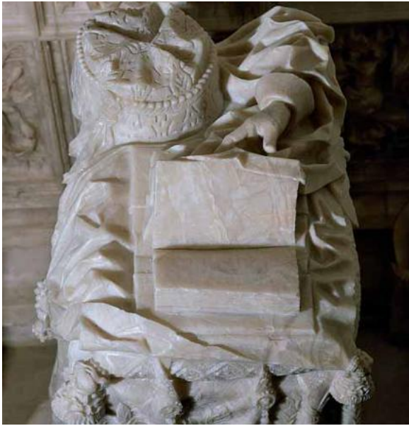
Fig. 4. Imagen en detalle del reclinatorio del sepulcro. En él se encuentra un libro, un sombrero y una mano aislada.