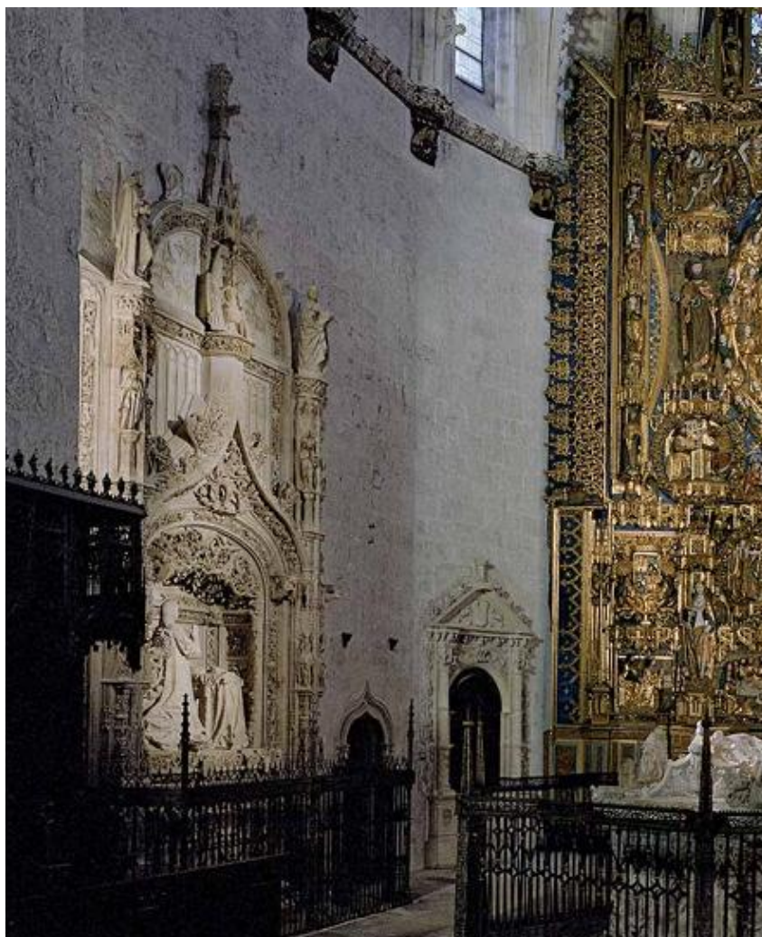
Fig. 1. Vista lateral del sepulcro del infante Alfonso en la Cartuja de Miraflores.