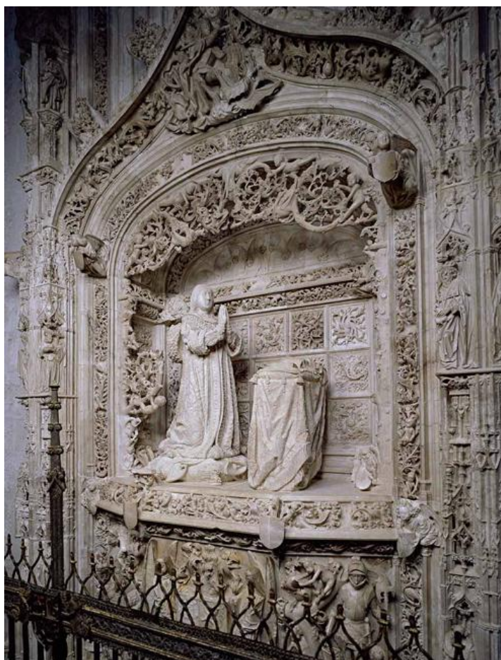
Fig. 2. Vista frontal del sepulcro del infante Alfonso en la Cartuja de Miraflores. Extraído de: Fundación Iberdrola, La cartuja de Miraflores I: los sepulcros , Cuadernos de restauración de Iberdrola XIII, Madrid, 2007, p. 57.