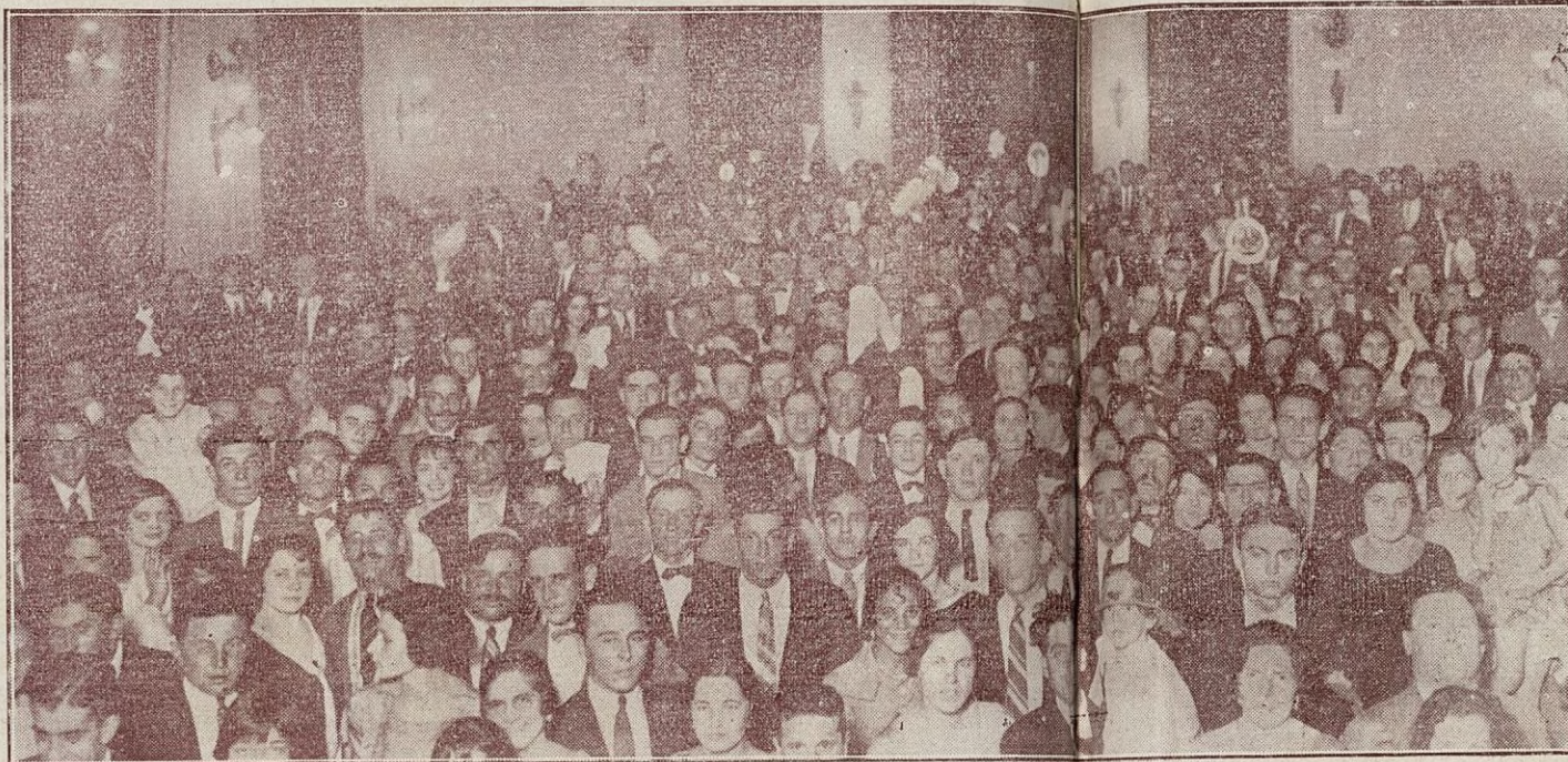
Una parte de la numerosa concurrencia en el salón de la fiesta

y simpática de su hermosura y sus finas dotes de amable condescendencia social. A ellas que con sus encantos venusinos, supieron refrendar anhelos y esperanzas, vayan nuestra gratitud sincera y expresiva, ya que al ofrendarles el reconocimiento a que todas se han hecho acreedoras, cumplimos con nuestra caballeresca hidalguía corcubionesa.