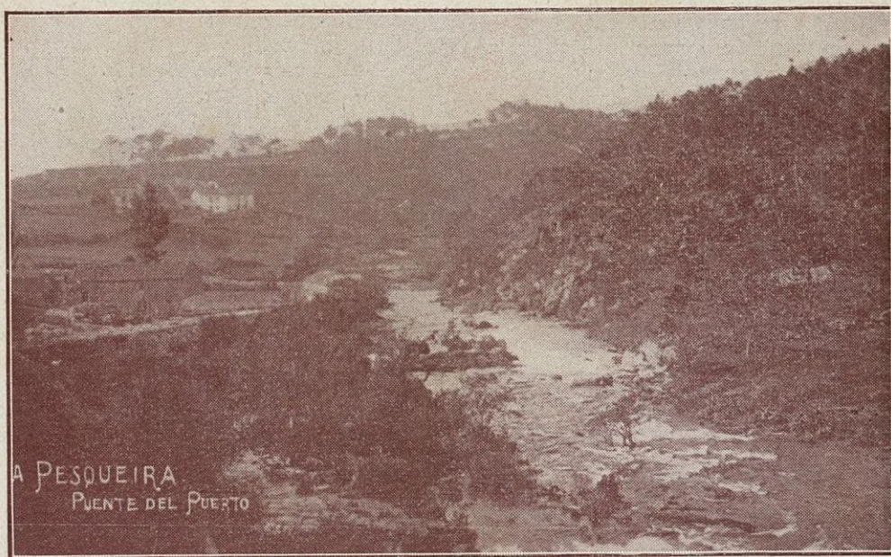
“A Pesqueira” en Puente del Puerto. ¡Quién no siente la deliciosa “morriña” de los patrios lares a la vista de este prodigio de la naturaleza? Galicia, eres sublime!!