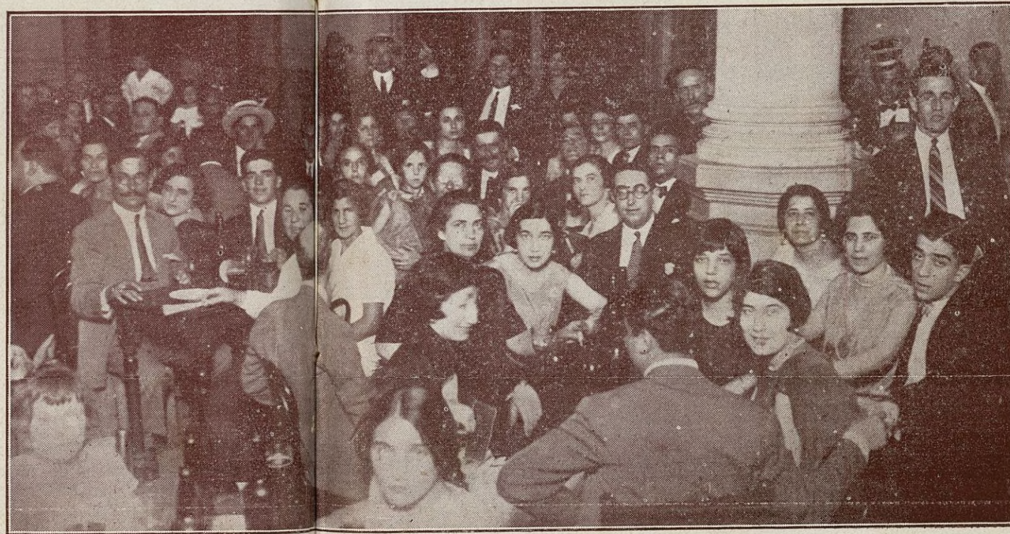
Otra vista de la fiesta, Haciendo frente a las inclemencias del calor

sas tan gratas al sentimiento, impregnaron sus almas de dulzuras infinitas.