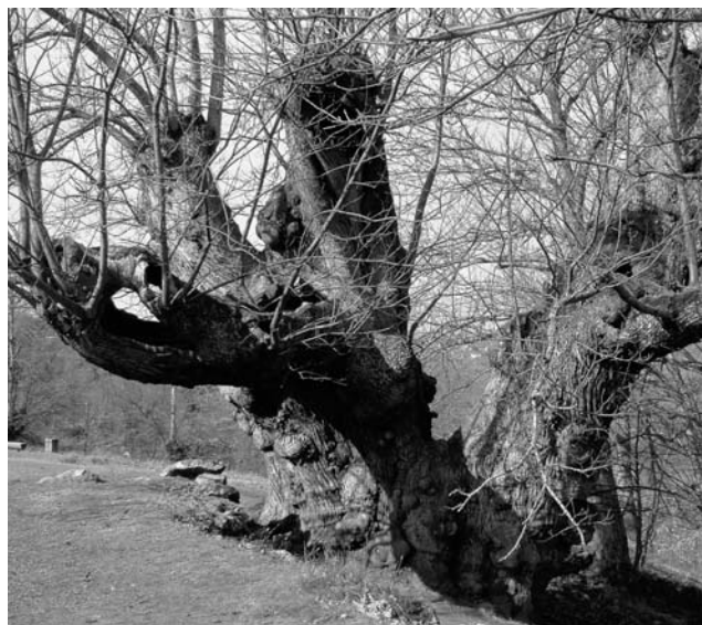
Figura 3. Castiñeiro de Pumbariños (Manzaneda, Ourense)

eles podemos destacar a Oliveira do Paseo de Alfonso XII, os Tulipeiros de Virxinia do Pazo de Castrelos ou as Casuarinas da Alameda da Praza de Compostela.