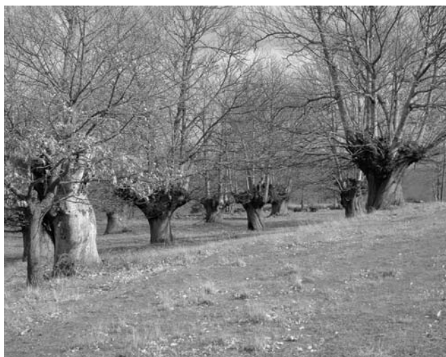
Figura 2. Souto de Rozabales (Manzaneda, Ourense)

O último Monumento Natural declarado no ano 2000 foi o Souto de Rozabales (Decreto 78/2000, de 25 de febreiro). Trátase dun conxunto de castiñeiros con troncos de grandes dimensións que permanecen sen ramificar ata 2-3 m de altura, onde se forma a cruz e comeza a formarse a copa, que se renova cada poucos anos para aproveitar a leña e a madeira e, sobre todo, para favorecer unha boa produción de castañas de bo calibre (figura 2). Foron plantados en ringleiras que aínda se aprecian e, en xeral, gozan dun estado de saúde bastante bo, entre outras razóns porque a altitude e o clima limitan a incidencia dos fungos causantes da doenza da tinta ( Phytophthora spp.) e do chancro, Cryphonectria parasitica (Murrill) M. E Barr. Entre todos os castiñeiros presentes no souto destaca un, o Castiñeiro de Pumbariños, con algo máis de 12 m de perímetro basal e unha idade próxima os 1000 anos (Domínguez Lerena 2007), convertíndose así nun dos exemplares mais vellos de Galicia e posiblemente de todo o estado español.