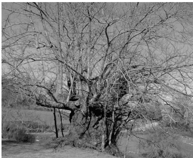
Figura 7. Castiñeiro de Pexeiros (Os Blancos, Ourense)

De castiñeiros revisamos case 200 exemplares senlleiros, espallados por toda a xeografía galega, case todos terían sido catalogados en calquera outra Comunidade Autónoma, pero a nómína de castiñeiros monumentais galegos é elevada e precisamente por iso os requisitos esixidos a esta especie para entrar no catálogo son altos. Tódolos exemplares incluídos na ampliación teñen un perímetro normal arredor dos 10 m e soen ser bos produtores de froito. Destaca o castiñeiro de Pexeiros (Os Blancos, Ourense), sen dúbida a mellor representación galega da especie, mérito que comparte co castiñeiro de Pumbariños, no concello tamén ourensán de Manzaneda. De porte esvelto e de grandes dimensións (perímetro basal: 14,8 m) non ten ningún problema en aparencia, nin fisuras, nin ocos nin podremias; a súa copa é aberta e equilibrada e tal vez o único inconveniente sexa a súa localización, xa que medra nun valado, pero non parece correr perigo.