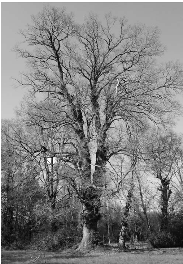
Figura 5. Carballa da Rocha (Rairiz da Veiga, Ourense)

O Concello de Pontevedra publicou no ano 2006 un libro dedicado ao carballo da Capela de Santa Margarida (Rodríguez Dacal, 2006), no que se recolle a historia deste monumental carballo, único supervivente da época da Carballeira dos Gafos. Xa en 2007 a Xunta de Galicia declara Monumento Natural a carballa da Rocha, en Rairiz