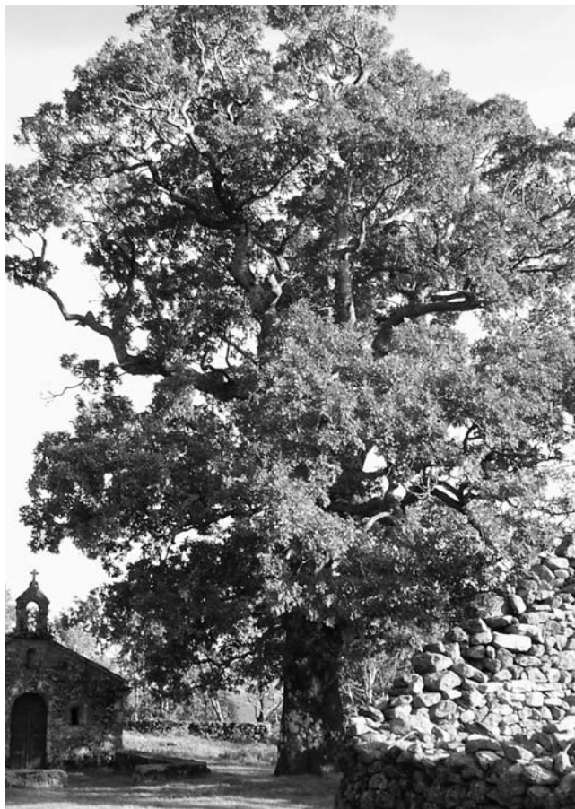
Figura 9. Cerquiño de Queguas (Entrimo, Ourense)

Pontevedra), cuxa orixe parece derivar do espallamento dos loureiros que facían de sebes entre os terreos de cultivos abandonados durante a expropiación da illa para a posterior doazón ao Rei Alfonso XIII en 1907 (Bernárdez et al. 2011).