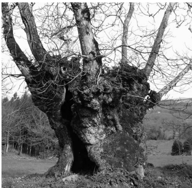
Figura 8. Nogueira de Licín (O Saviñao, Lugo)

Outro exemplar excepcional é a nogueira de Licín (O Saviñao, Lugo), de grandes dimensións (perímetro basal 8,55 m e perímetro normal 7,60 m), con fuste completamente fendido e con moi pouca madeira. A copa amosa un par de ramas que son as que o manteñen con vida. O seu estado sanitario non parece bo, pero é un dos mellores representantes da especie en Galicia, polo que é moi importante a súa conservación.