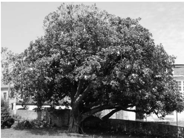
Figura 4. Magnolia grandiflora de Santa Rita (Narón, A Coruña)