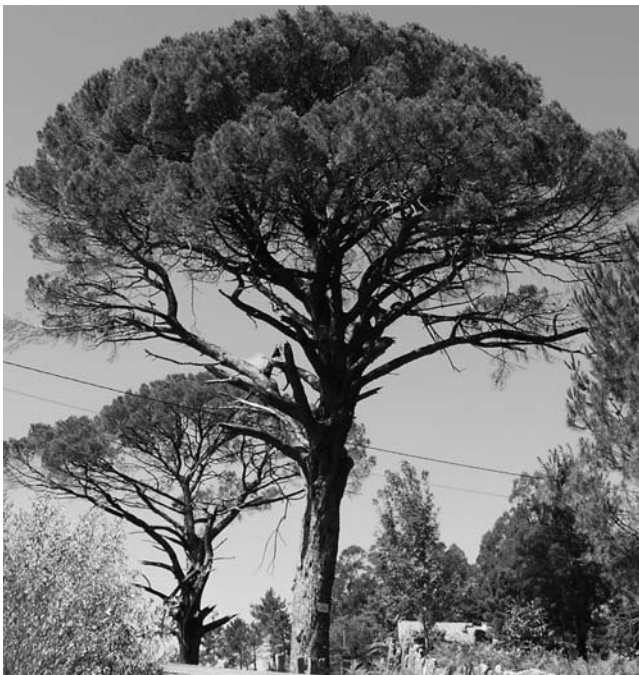
Figura 12. Piñeiro manso de Os Candeiras (Ponteareas, Pontevedra)

Entre os exemplares publicados no catálogo (Decreto 67,2007) temos que lamentar a morte dunha das faias de Castrelos (Vigo, Pontevedra) e do piñeiro manso dos Candeiras (Ponteareas, Pontevedra). Máis recentemente desapareceu o chopo branco do Balneario de Cuntis (Pontevedra), derrubado por un temporal a finais de outubro de 2011; catalogado na ampliación realizada no mesmo mes de outubro (Orde do 3 de outubro de 2011), non permaneceu en pé nin un mes tras ser catalogado. Aínda que son estas malas novas, hai que recordar que se trata dun catálogo que reúne, na maior parte dos casos, exemplares de moita idade, febles e doentes, nos tramos finais das súas vidas. Ademais, trátase dun catálogo aberto, do que caerán exemplares e entrarán outros. Polos estudos que temos feito dedúcese que en Galicia existen centos de exemplares que serán merecedores de entrar no catálogo en próximas revisións.