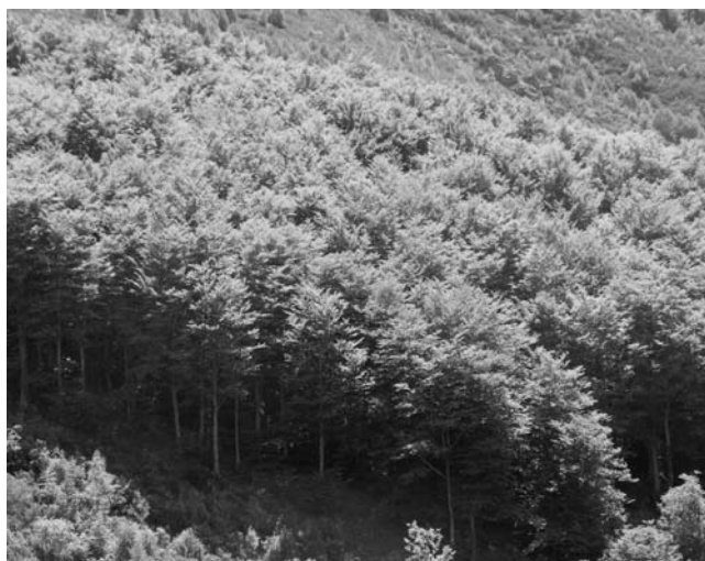
Figura 10. Faial do Tarín, Fonteformosa (Pedrafita do Cebreiro, Lugo)