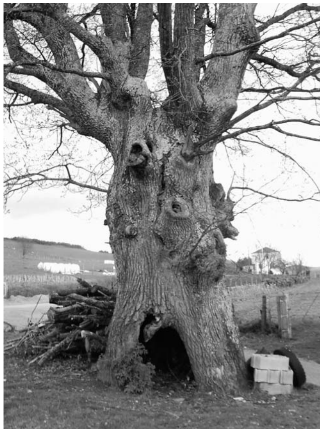
Figura 11. Carballo híbrido da Praza do Campo de Quindous (Cervantes, Lugo)