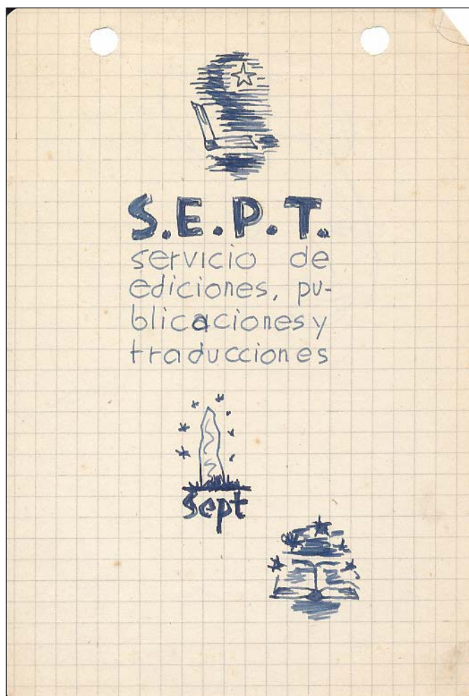
Esbozo de logotipos realizados por Xaime Isla. 1946

El mercado de librería en nuestra Región ofrece un desarrollo deficiente en todos los aspectos: primero, en cuanto a la extensión, reducido al número relativamente escaso de librerías, existentes tan sólo en las ciudades más importantes, con abandono de las pequeñas villas y aldeas que constituyen la mayoría de la población gallega; en segundo término, con respecto al surtido, limitado a las novedades de librería nacional, y finalmente, en relación con la información y documentación bibliográficas para orientar a los lectores, inexistente por completo.