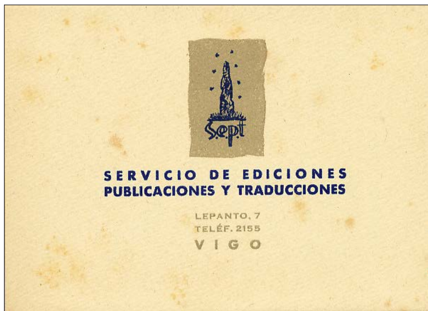
Tarxeta postal, ca. 1946-1948

subscrición das accións de Galaxia en 1949 debían remitirse precisamente á sede de SEPT, entidade que naquela altura tiña unicamente unha existencia nominal.