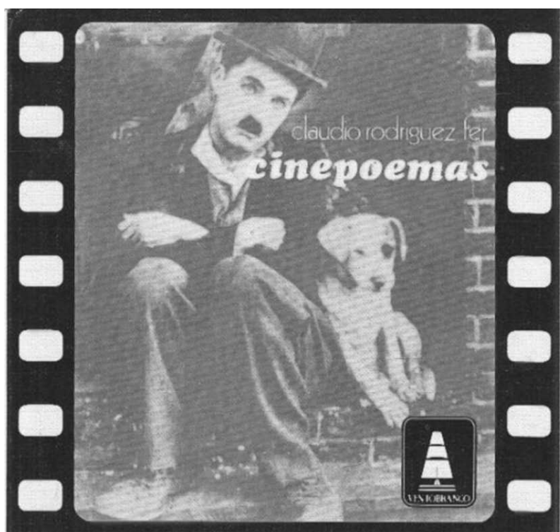
Cinepoemas , primera edición (1983)

algebraico de Orson Welles”. Posteriormente, esta fascinación por el cine trajo consigo poemas y artículos que reflexionan sobre múltiples temas relacionados con el séptimo arte. No obstante, Cinepoemas es, sin asomo de dudas, la obra suya que mejor condensa la fusión interartística de los lenguajes poético y cinematográfico, pues como bien señaló Armando Requeixo, “ Cinepoemas é un atlas fílmico-vital, unha crónica en fotogramas poetizados dunha sorte de educación sentimental cinematográfica ou, se se quer, un compendio lírico daquelas cintas que deixaron marca indeleble na ánima do autor”. Solo desde esta visión vital y abarcadora se entiende que Rodríguez Fer concluya el umbral de Cinepoemas considerando “este libro restaurador da miña vida e da miña obra de cine”.