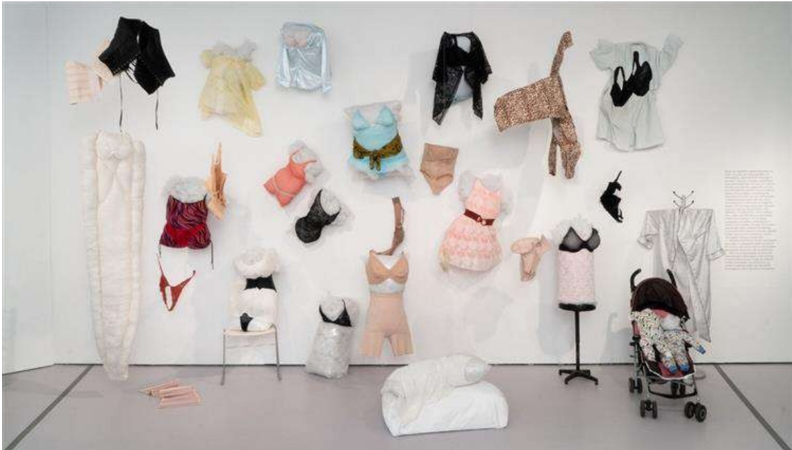
Fig. 9. Rosler, M. (1973-2018). Objects With No Titles [Instalación de esculturas].

I WISH TO BECOME A GOURMET. I DO THIS BECAUSE I FEEL IT WILL ENHANCE ME AS A HUMAN BEING. THAT IS, IT WILL BETTER ME AND MAKE ME A MORE VALUABLE PERSON TO MYSELF AND OTHERS. I WILL BE MORE KNOWLEDGEABLE ABOUT THE GOOD THINGS, THE THINGS THAT MAKE LIFE PLEASANT. THE GOURMET IS A SENSITIVE PERSON; HE KNOWS GOOD FROM BAD AND FROM NOTHING-SPECIAL. QUALITY. ANIMALS EAT TO SATISFY THEIR HUNGER, TO STAY ALIVE. AS PEOPLE WE DON'T HAVE TO DO THAT. I MEAN WE DON'T HAVE TO DO ONLY THAT. WE CAN MAKE EATING INTO AN EXPERIENCE . WE DON'T HAVE TO WORRY ANY MORE ABOUT WHERE THE NEXT MEAL WILL COME FROM--FAR FROM IT! IF ANYTHING, WE EAT TOO MUCH. THERE'S FOOD ALL AROUND. THE QUESTION IS HOW TO PICK AND CHOOSE--TO KNOW WHAT'S REALLY GOOD. . . . 1