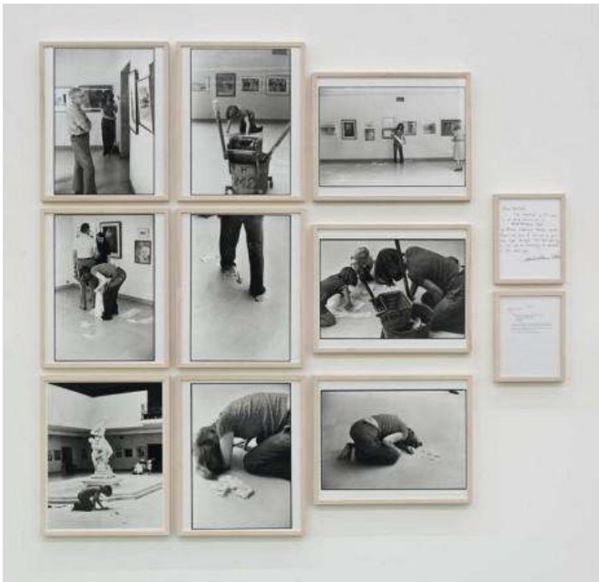
Fig. 20. Landerman Ukeles, M. (1973). Washing/Tracks/Maintenance: Inside, July 22, 1973 [Serie fotográfica]. David Kordansky Gallery, Nueva York.