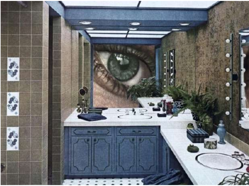
Fig. 3. Rosler, M. (1967-1972). Bath Surveillance de la serie Body Beautiful, or Beauty Knows No Pain [Fotomontaje, originalmente un collage ]. 46 x 48.6 cm. Tang Teaching Museum and Art Gallery, Saratoga Springs, Nueva York.