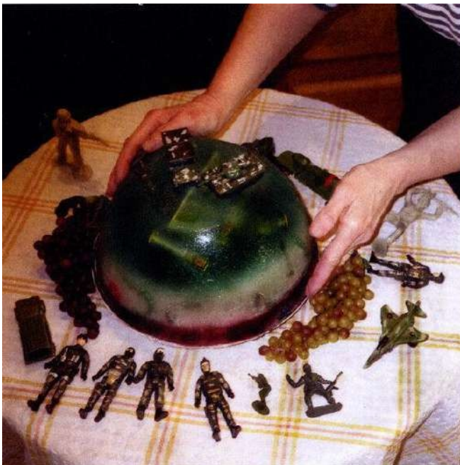
Fig. 13. Rosler, M. (2003). Patriotic Jell-O Salad [Libro ficticio de cocina]. Fotografía de una página del libro proporcionada por la artista en su web martharosler . © Martha Rosler.