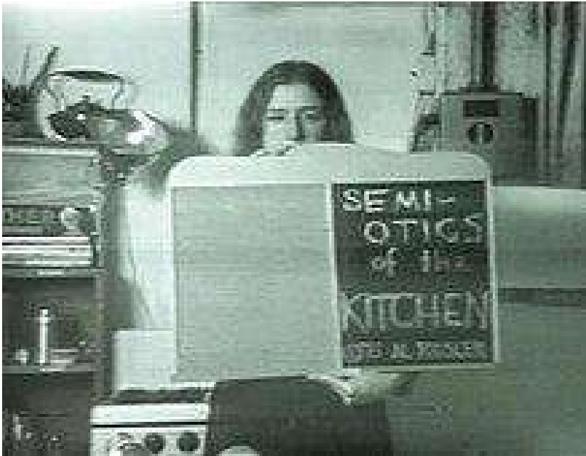
Fig. 14. Rosler, M. (1975). Semiotics of the Kitchen [Video]. Fotograma de la obra recogida en la entrevista a Rosler por parte de The Museum of Contemporary Art (2012): Martha Rosler – Semiotics of the Kitchen – West Coast Video Art – MOCAtv.