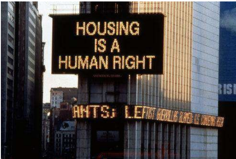
Fig.21. Rosler, M. (1989). Housing Is a Human Right [Billboard]. 74,32 m 2 , duración 1:10 min. Fotografía de una de las doce ofrecidas por la artista en su web martharosler . © Martha Rosler.