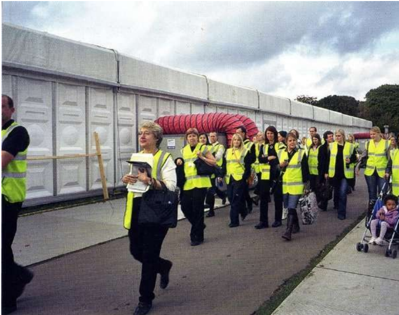
Fig.18. Rosler, M. (2006). Surface/Support [Tour]. Fotografía del tour. © Martha Rosler.