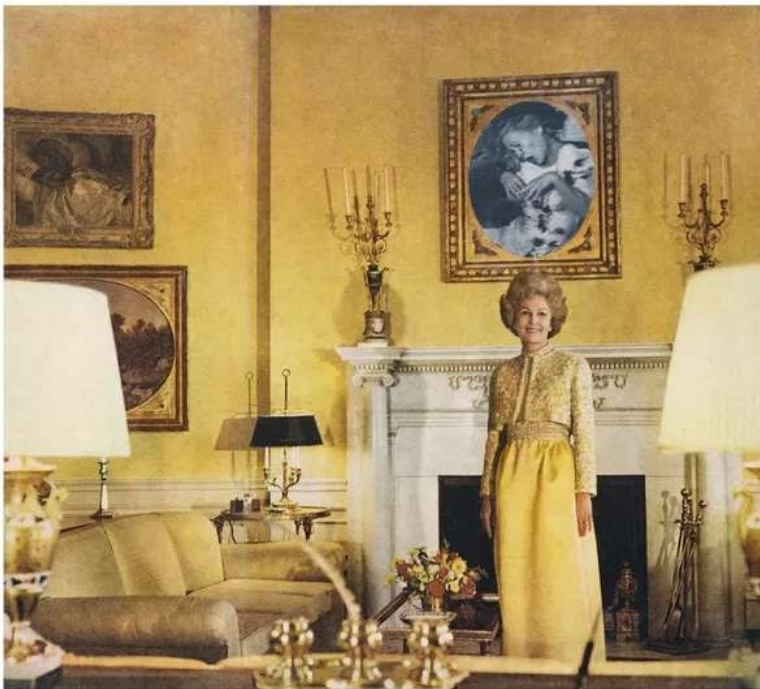
Fig. 4. Rosler, M. (1967-1972). First Lady de la serie se Beautiful: Bringing the War Home [Fotomontaje, originalmente un collage ]. 50.1 x 56 cm. Committee on Photography and The Modern Women's Fund. © c. 1967-72 Martha Rosler.