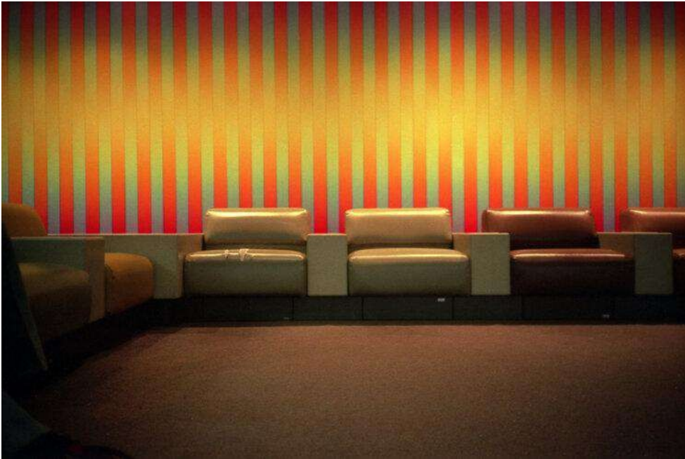
Fig.16. Rosler, M. (1983-presente). Seattle Stripes (n.d.) de la serie In the Place of the Public: Airport Series [Fotografía].