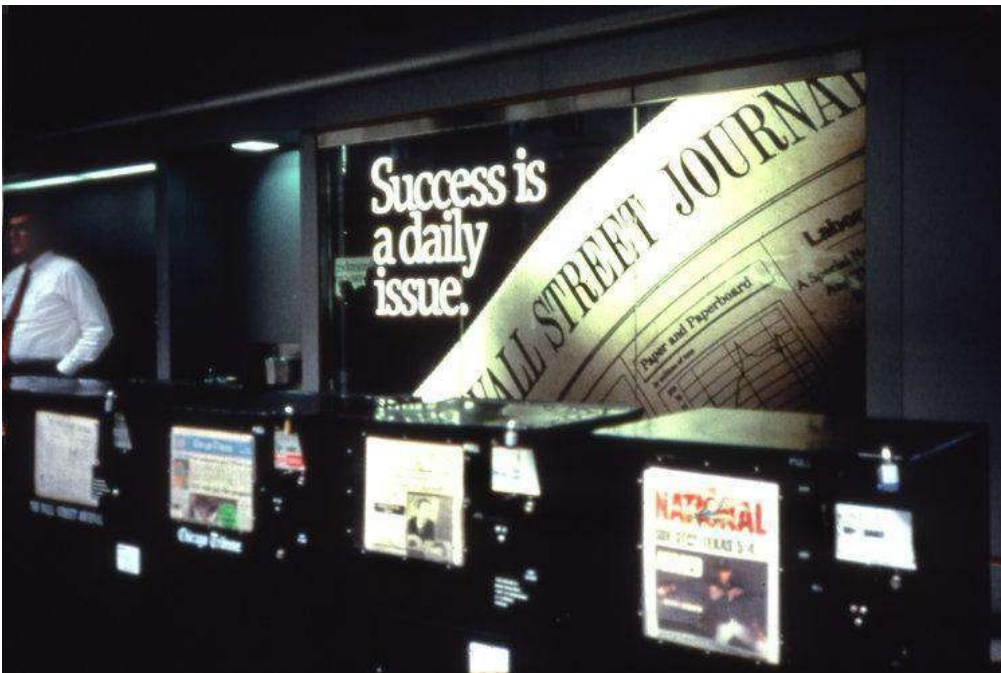
Fig.17. Rosler, M. (1983-presente). O'Hare, Chicago (n.d) de la serie In the Place of the Public: Airport Series [Fotografía]. © Martha Rosler.