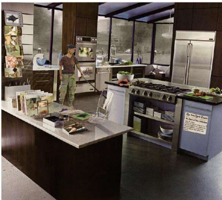
Fig. 7. Rosler, M. (2004-2008). Election (Lynndie) de la serie House Beautiful: Bringing the War Home, New Series [Fotomontaje]. 50.8 × 61 cm. Seattle Art Museum, Seattle, Seattle. Cedida al museo por la artista y la galería Mitchell-Innes & Nash, NY.