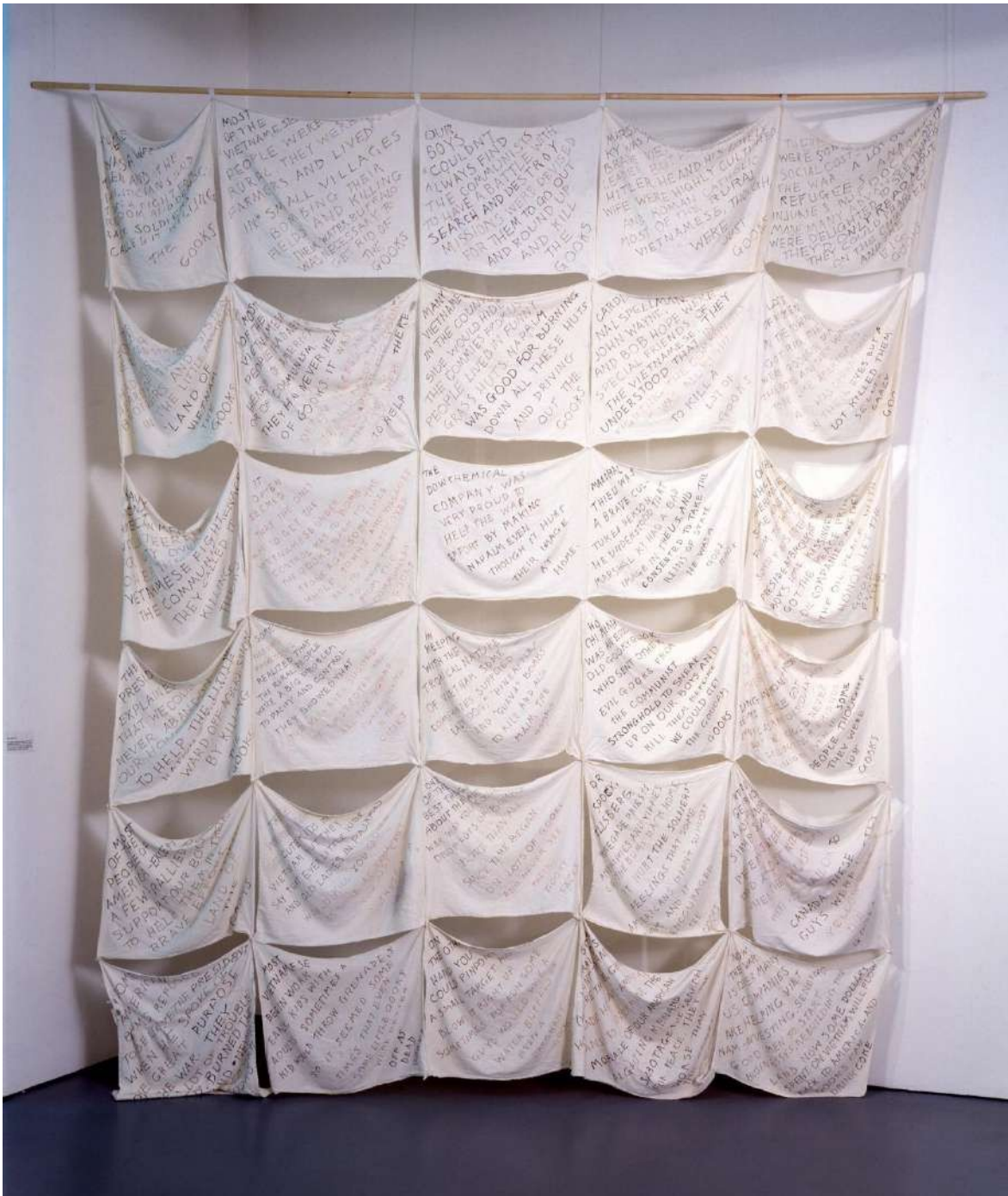
Fig. 8. Rosler, M. (1973-1975). Diaper Pattern [Instalación con texto y pañales de tela].