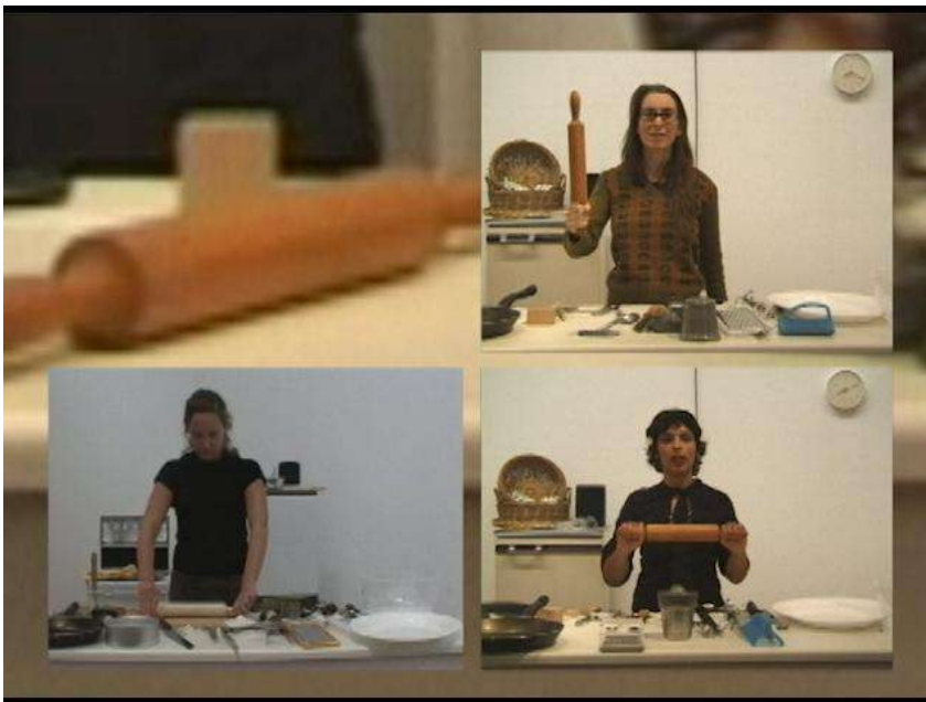
Fig. 15. Rosler, M. (2011). Semiotics of the Kitchen: An Audiction [Video]. 4:3. Fotograma de la performance y videocreación.