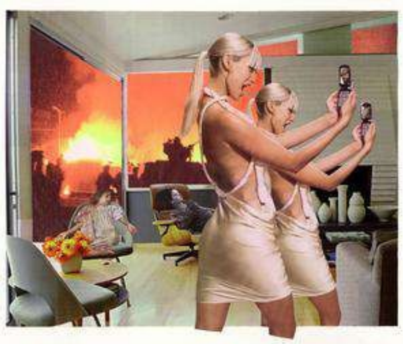
Fig. 6. Rosler, M. (2004-2008). Photo-Op de la serie House Beautiful: Bringing the War Home, New Series [Fotomontaje]. 50.8 × 61 cm. Seattle Art Museum, Seattle, Seattle. Cedida al museo por la artista y la galería Mitchell-Innes & Nash, NY.