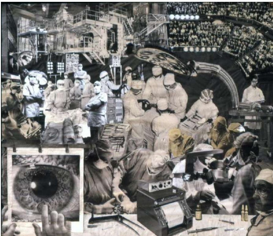
Fig. 2. Rosler, M. (1967). Medical Surveillance [Fotomontaje, originalmente un collage]. 1267 x 1079. Martha Rosler.