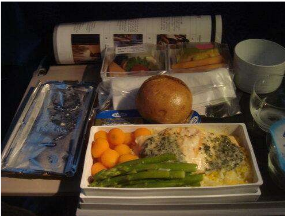
Fig.19. Rosler, M. (2008-presente). Fotografía de la serie fotográfica Air Fare [Fotografía] © Martha Rosler.