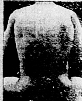
Después de 15 días de tratamiento