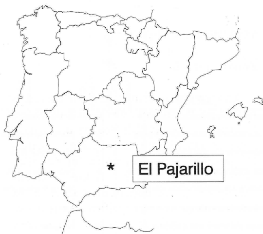
Fig.1. Localización del yacimiento de "El Pajarillo" (Huelma. Jaén).

presencia climática de Pinus nigra en la Cuerda del Milagro y en la misma Sierra de Huelma, donde ha quedado muy reducido por la tala y la naturaleza pedregosa del terreno.