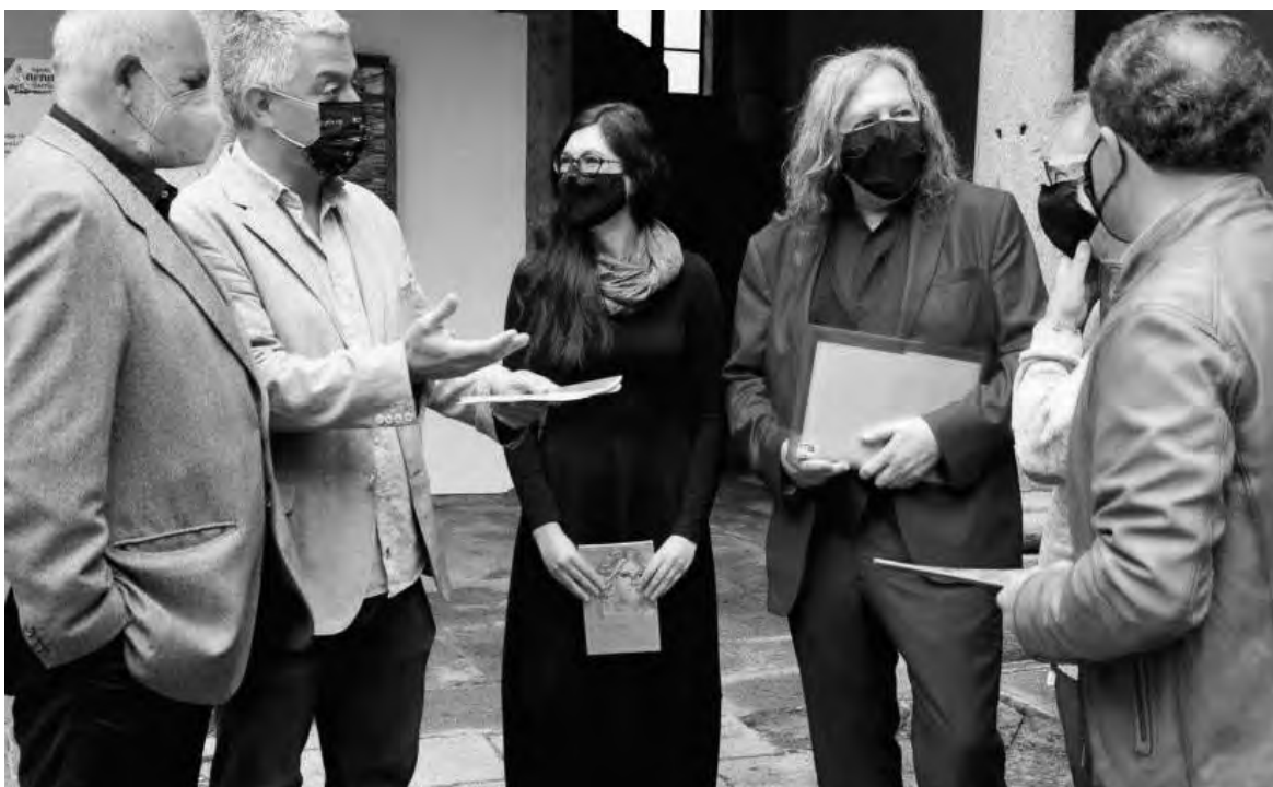
Intervenientes na presentación, en Santiago de Compostela, de Unha camelia / One camellia blossom en 2021

anglófonas, pois afirma rotundamente unha dobre preferencia: “Sempre, Shakespeare, en verso e traducido a prosa”. Así que non é de estrañar que mencione tamén entre os seus personaxes favoritos precisamente aos shakespearianos Romeo e Xulieta.