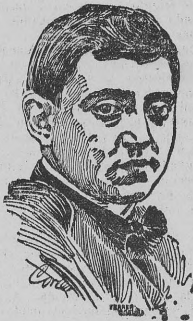
ANTONIO REY SOTO

El día 17 del mes que hoy se inicia cumplirá 84 años el ilustre historiador galaico don Manuel Martínez Murguía, actual Presidente de la Real Academia Gallega. La vida de Murguía constituye un relevante ejemplo de patriotismo y de consagración al Arte. Trasládese muy joven á Madrid, donde entró de redactor en "La Iberia", y publicó la novela titulada "Desde el Cielo".