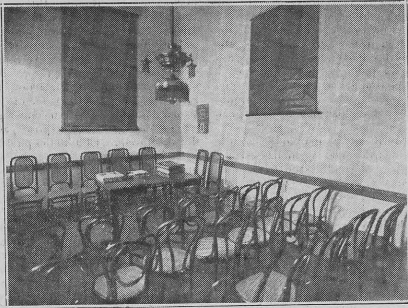
SALÓN DE SOCIEDADES REGIONALES EN NUESTRO DOMICILIO SOCIAL