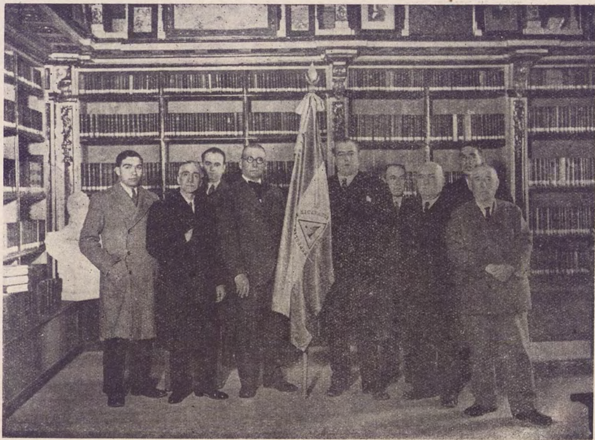
Acto de entrega, de la bandera de Nicaragua, en la Biblioteca "América"