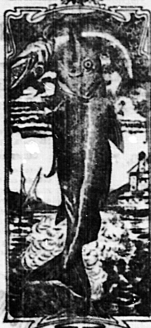
La última palabra

Nos referimos a una nueva y excelente preparación de Emulsión «DOS PESCADOS» (marca registrada) la que compete con todas, las extranjeras y españolas, tanto en calidad como en precio. Depositarios: por menor, Farmacia y Laboratorio de Iglesias.