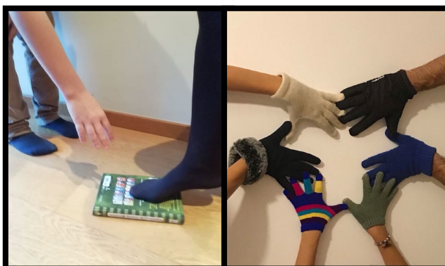
Figura 3. Imágenes de respeto creadas por el alumnado de 5º de primaria