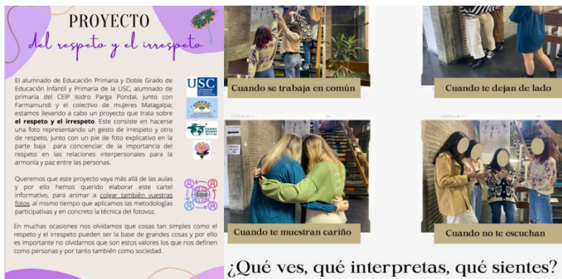
Figura 5. Cartel informativo y gestos de respeto e irrespeto desde la universidad