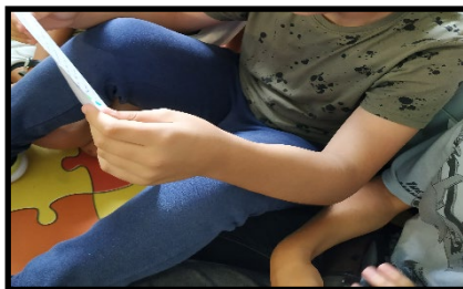
Figura 1. Lectura del registro del diario de incidencias