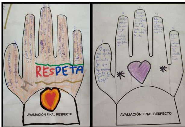
Figura 7. La evaluación final del respeto en nuestras manos