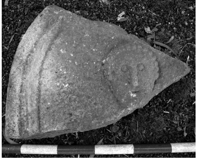
Fig. 4. Fragmento de estela con cabeza masculina en bajorrelieve.

simple luna creciente. Más complicado es el análisis de la conocida estela de Iulius Seuerianus (nº 35), de casi dos metros de altura: una moldura con surco limita ambos espacios figurativo y epigráfico, sólo separados por una cartela a modo de tabula ansata . Justo encima de ésta se encuentra la figura de un hombre vestido con un simple pileus y que sostiene en su mano izquierda las riendas de un caballo situado tras él. En la diestra sostiene un objeto alargado hoy irreconocible (lanza, antorcha?) por el desgaste de la piedra. A la derecha de la cabeza humana, una estrella de seis puntas lanceoladas, enmarcando la escena, en los esquinales superiores, sendos racimos de uvas. Las interpretaciones (Balil, 1974) que se han dado a semejante conjunto figurativo han sido de lo más variopinto: soldado de caballería, mercader de vinos, Dióscuro, apoteosis venatoria... siendo la opción de la divinidad la más verosímil 18 . Coincidimos con Balil al afirmar que en “la estela [...] se desarrolla un texto cuyo contenido es independiente del simbolismo