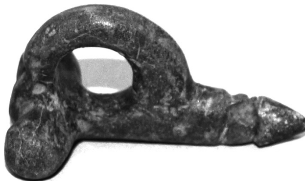
Fig. 5. Colgante-amuleto fálico.

marcados con incisiones lo datan en el siglo III d. C. de acuerdo con la clasificación de Casal García (1995: 207-208). Estaríamos, por tanto hablando de nuevo de una “producción artística de carácter culto, común a todo el Imperio Romano y que está al servicio de una población provincial (no provinciana) romanizada [...] que copia el mundo oficial y áulico de las metrópolis” ( Ibid. : 205).