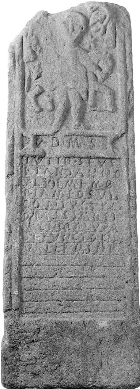
Fig. 3. Estela de Iulius Seuerianus.