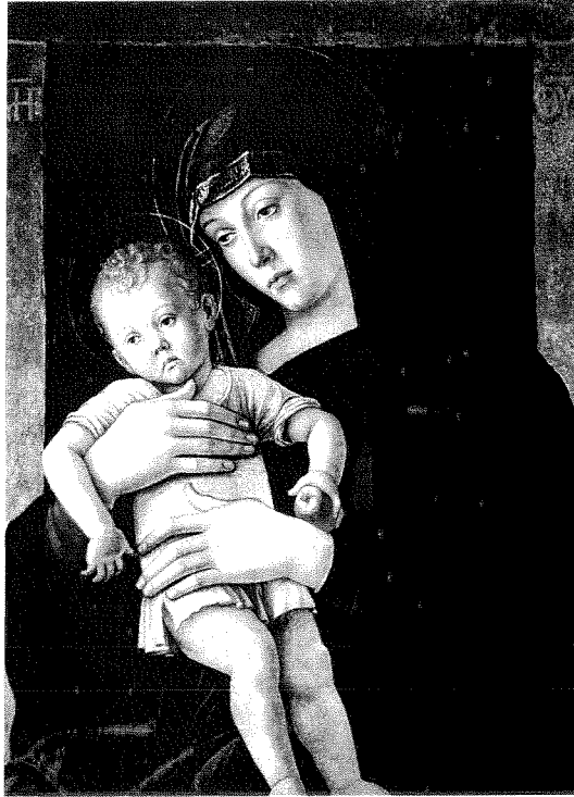
Figure 1. BELLINI, G.: Madone Grecque . 4

réalité un faux automate, puisqu'il s'agit d'une actrice —une simulatrice professionnelle— venue à Venise pour représenter au théâtre L'Homme au sable d'Hoffmann. Comme elle y jouait le rôle de l'automate Olympia, le Comte l'exhorte à continuer son interprétation pour le faux peintre. À la fin, «Je», pris d'un élan d'humanité, croit étrangler l'automate, alors qu'il tue la vraie femme... Venise devient, une fois de plus, la scène d'une mascarade du faux à donner le vertige.