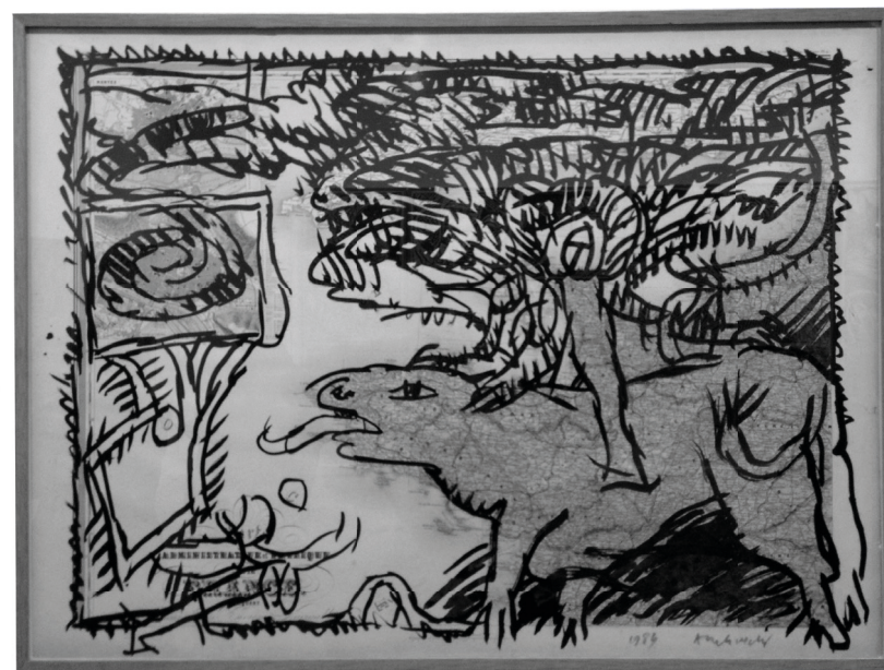
» “Page d’Atlas Universal” [Páxina dun Atlas Universal], de Pierre Alechinsky. 1984, tinta sobre lámina escolar do século XIX.

También hay un componente cinematográfico en las obras de Alechinsky. La viñeta, que recuerda al friso decorativo, está presente a modo de marco en sus dibujos. Eisenstein, el cineasta ruso que “inventó” el montaje moderno, se inspiraba en la pintura clásica —el Greco entre otros— para componer sus películas, anticipando la visión de celuloide que muchos pintores tenían sobre sus obras. Alechinsky construye en algunos de sus grabados, una secuencialidad que nos retrotrae al celuloide. La mecánica y el movimiento, la pausa y el ritmo son elementos imprescindibles para poder comprender el expresionismo abstracto. Pero todavía hay más, la organicidad del trazo de Alechinsky