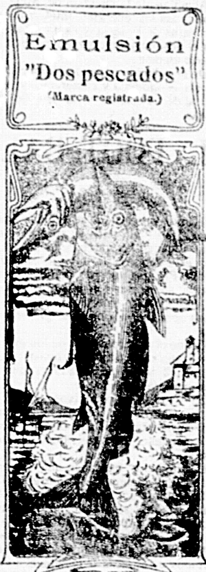
Emulsión "Dos pescados" (Marca registrada.)

Nos referimos a una nueva y excelente preparación de Emulsión «DOS PESCADOS» (marca registrada) la que compete con todas, las extranjeras y españolas, tanto en calidad como en precio. Depositarios: por menor, Farmacia y Laboratorio de Iglesias. Por mayor, Droguería de Iglesias y Compañía.