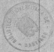
EXCMO. SR. D. EUGENIO MONTERO RÍOS

Benefactor incansable de su urbe nativa y gloria muy prestigiosa de la Universidad Literaria Compostelana, en la que hizo los estudios jurídicos, figurando, más tarde, entre el número de sus más doctos maestros. MARUXA, publicación escolar y santiaguense, cree satisfacer un deber hacia la memoria de tan insigne Patricio, honrando esta página con su retrato en el tercer aniversario de su muerte.