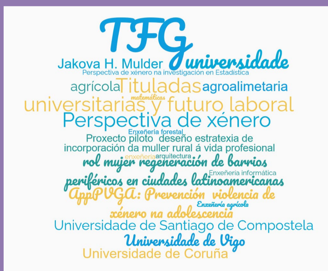
Nube de palabras con TFG en CTEM con perspectiva de xénero