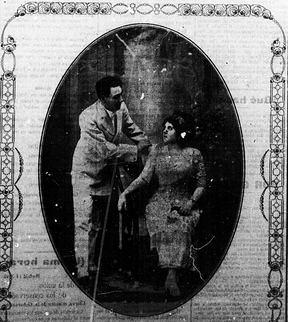
LES CHIMENTI que actúan con éxito en LUGO SALON

Sea los días de la noche. El viento bate