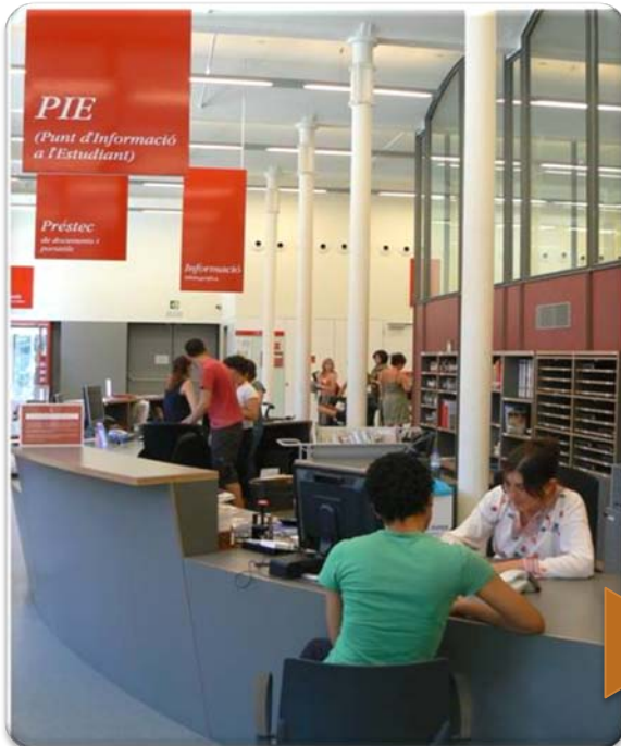
Punto de evaluación