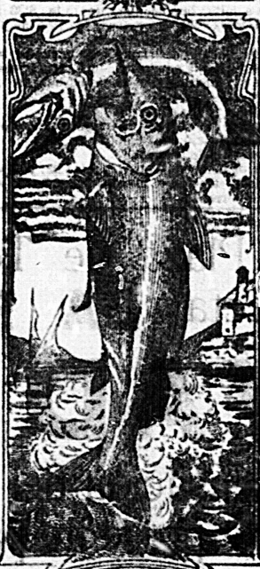
La última palabra

Nos referimos a una nueva y excelente preparación de Emulsión «DOS PESCADOS» (marca registrada) la que compete con todas las extranjeras y españolas, tanto en calidad como en precio.