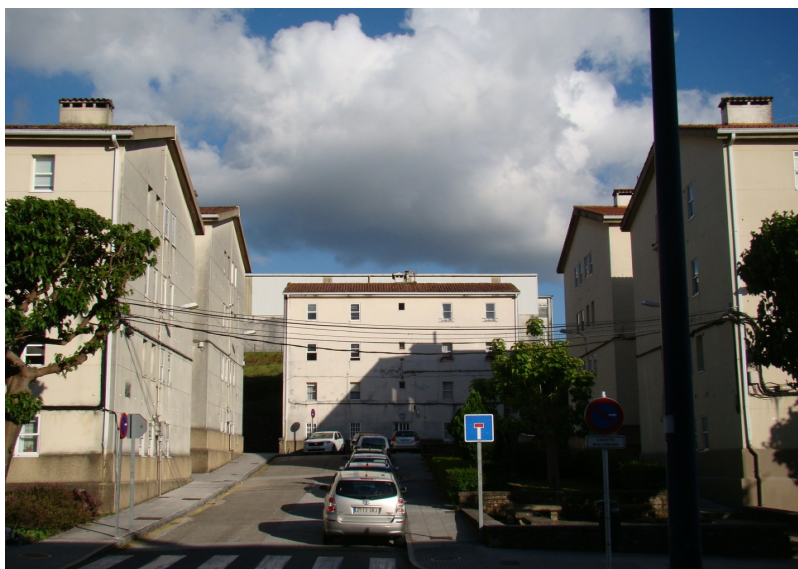
Figura 8. Grupo de Viviendas Diego Gelmírez, 1954

Para tratar de responder a estas preguntas he realizado cuatro entrevistas a vecinos del grupo de viviendas José Antonio Primo de Rivera. 35 Tres de ellos habitan todavía hoy en casas del grupo (dos desde su entrega en 1950 y una tercera desde 1961, cuando compró la casa a sus propietarios originales). El cuarto, vecino del barrio de A Choupana, está casado con una antigua inquilina de una casa de la OSH. He contado con un quinto testimonio, el de un residente en otro grupo de setenta y dos viviendas de la OSH, el grupo Arzobispo Diego Gelmírez, situado en el mismo barrio, a unos doscientos metros del grupo José Antonio, e inaugurado algo más tarde, en 1954.