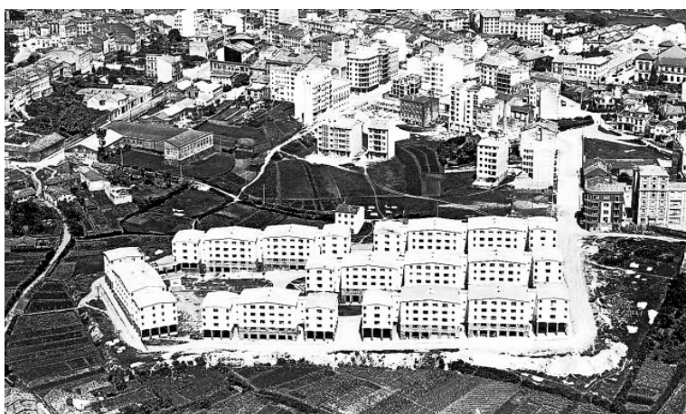
Figura 5. Vista del Grupo de Viviendas Santiago Apóstol (Casas de Ramírez) en 1969.

En Santiago, 1955 fue el año de arranque de dos de los más importantes proyectos de la OSH en la ciudad: el Grupo de viviendas protegidas Santiago Apóstol, popularmente conocido como “casas de Ramírez” y el Grupo de viviendas protegidas Compostela. Con el primero, situado en el corazón del nuevo ensanche de la ciudad, se perseguía la construcción de 248 viviendas (finalmente fueron 212). El proyecto fue aprobado por el ayuntamiento en diciembre de 1954, autorizando la corporación la expropiación de terrenos en mayo de 1955. Las viviendas se entregaron a finales de septiembre de 1960. En todo caso, todavía a la altura de 1964, el arquitecto municipal redactaba el proyecto de pavimentación y urbanización de las calles interiores del grupo y de las externas que lo delimitaban.