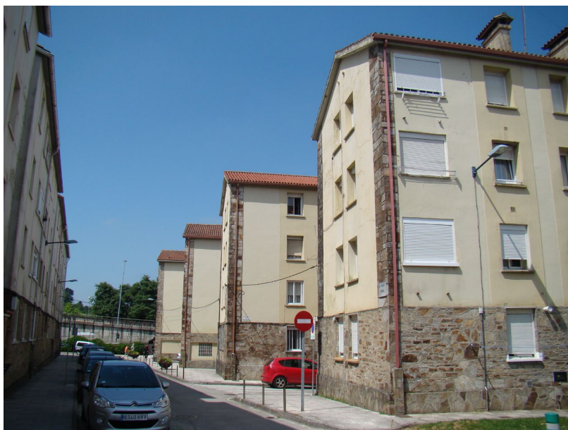
Figuras 6 y 7: Grupo de Viviendas Compostela. Segunda mitad de la década de 1950