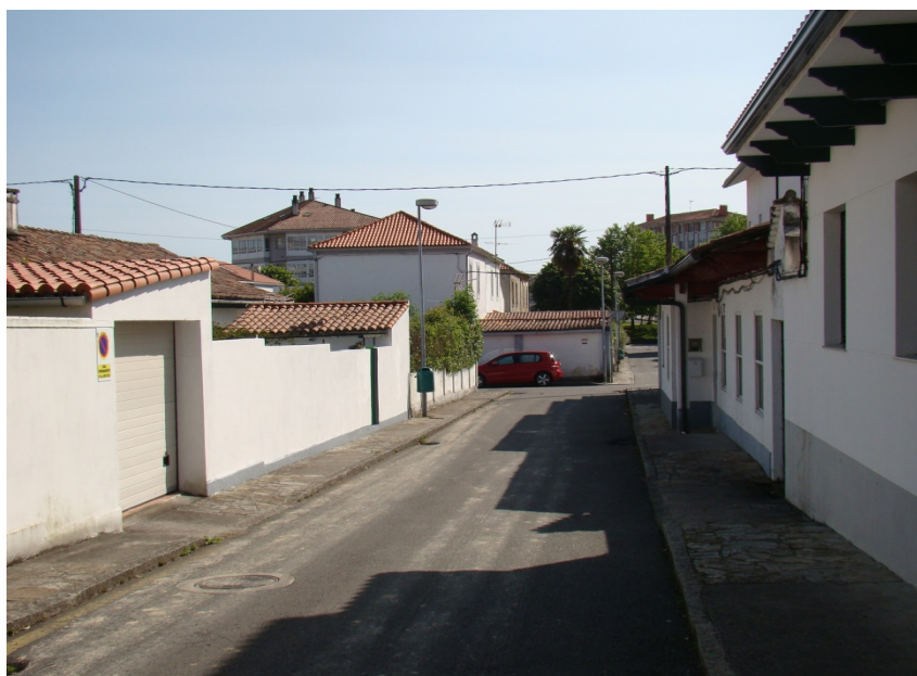
Figura 3. Vista de una calle interior del Grupo de Viviendas José Antonio Primo de Rivera. A Choupana

Los beneficiarios pagaban inicialmente una renta mensual a la Obra Sindical del Hogar. Pasados unos años la vivienda se podía adquirir en propiedad, lo que hicieron la mayor parte de las familias, abonando alrededor de 40.000 pesetas. Cualquier reforma debía de contar con el visto bueno de la OSH, si bien muchas pequeñas obras se realizaron sin su autorización. 26