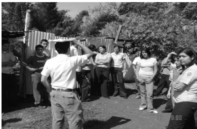
Fotografía 1.- Estudiantes de secundaria participan en giras ambientales interpretativas.

v.- El trabajo interdisciplinario ha tenido una significativa repercusión en con la participación de nuevas generaciones (más de 2500 estudiantes de secundaria) y educadores en los procesos de interpretación de la conflictividad socio ambiental, a través del desarrollo del programa de giras ambientales interpretativas seleccionando sitios de impacto que permiten en corto tiempo compartir conceptos y reconocerlos en sus expresiones de realidad, visualizando tanto la problemática como las alternativas que se están