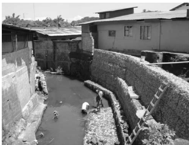
Fotografía 1.- Construcciones habitaciones dentro del cauce Burío Quebrada Seca.

sobrepasan la capacidad natural de drenaje y obstruyendo la obsoleta infraestructura de alcantarillas y puentes (CIMH, 2007).