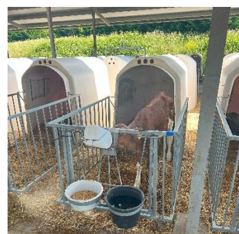
Figura 2: Caseta de polietileno en Recría Castro SL.

No caso específico de Recría Castro SL empréganse casetas de polietileno ( Figura 2 ) cercadas por unha estrutura ríxida de aceiro galvanizado en frío, na que se inclúe unha porta na parte frontal. Esta porta á súa vez ten dous soportes para baldes, un para a auga e outro para o concentrado. Ademais, conta cun soporte para colocar o biberón co que se lles proporciona o substituto lácteo ou outras formulacións hidratantes ás tenreiras. No interior da caseta localízase, nun dos laterais, unha forraxeira pequena. A caseta tamén inclúe un sistema de ventilación pasiva regulable na parte posterior, podendo regular a ventilación en función das condicións atmosféricas.