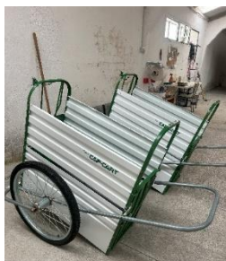
Figura 1: Carro transportador de tenreiras.

de correntes, facilidade de limpeza de materiais e instalacións e sita de xeito que os medios de transporte teñan que introducirse o mínimo posible dentro do espazo que ocupa o Centro. Estes criterios axudarán a manter a bioseguridade (Consellería do Medio Rural, 2009). Ao descargar as crías, estas deben permanecer confinadas ata que se lle realicen as inspeccións veterinarias correspondentes que permitan a súa inclusión no Centro. Por exemplo, en Recría Castro SL