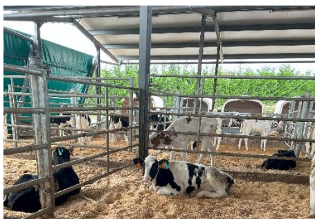
Figura 5: aloxamentos colectivos con cancelas e cama de serradura en Recría Castro SL (imaxe propia).

En canto ás características dos aloxamentos ( Figura 5 ), estes están constituídos por cancelas de