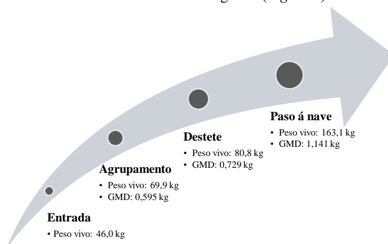
Figura 6: Esquema da evolución do peso vivo e da GMD dende a entrada ata o paso á nave.

O resumo dos movementos ata este momento é o seguinte ( Figura 6 ):