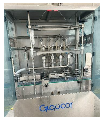
Figura 4: Sistema automático de recheo de biberóns en Recría Castro SL (imaxe propia).

A preparación do lacto-substitutivo é tan importante como a súa calidade ou o protocolo de administración. En Recría Castro, empréganse dous sistemas para axilizar a elaboración. O primeiro (Figura 4), automático, almacena unha gran cantidade de leite nunha cuba e enche os biberóns en cinta transportadora, optimizando tempo e man de obra, aínda que require control da cantidade dispensada. O segundo é un carro mesturador de 260 L que mantén o alimento a 44 °C, permitindo regular temperatura, mestura e volume por biberón. A elaboración segue as indicacións