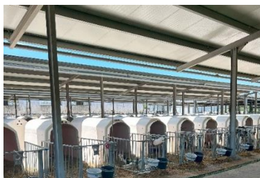
Figura 3: Liñas de boxes individuais en Recría Castro SL.

As casetas organizanse nun modelo de liñas, enfrontadas entre si cabeza a cabeza e separadas por un corredor dunha dimensión mínima recomendable de 2,5 m 2 (Consellería do Medio Rural, 2009). No caso do Centro de Castro de Rei atopámonos con corredores de 4m de ancho que