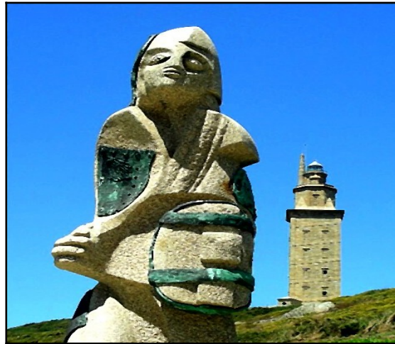
. Artabro na Torre de Hércules , Cernadas Iglesias, J. L. Disponible en Internet:

Lo que sabemos es que, antes de que llegasen los romanos, en la Edad de Bronce, aquí vivía un pueblo llamados los ártabros que vivían unos poblados fortificados, denominados castros, como el Castro de Elviña, muy pronto veremos cómo era vivir allí. De momento, te comento que puedes conocer a tres personas del pueblo ártabro en el Campo Escultórico; si te adentras en los caminos encontrarás una escultura de Arturo Andrade que representa a un guerrero, a un marinero y a una mujer ártabra.