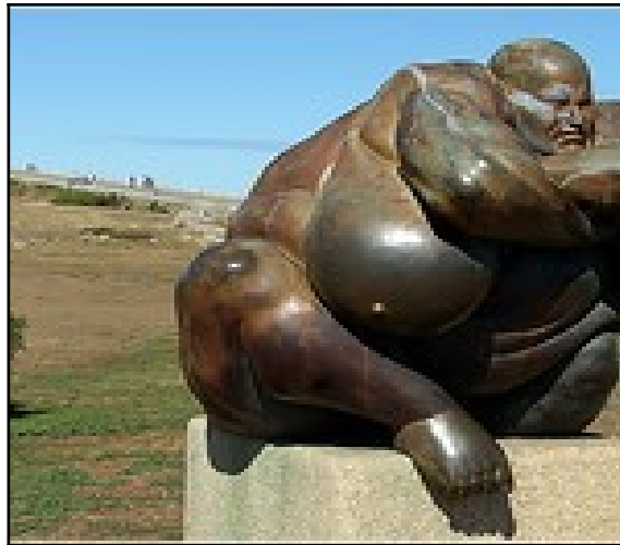
Caronte