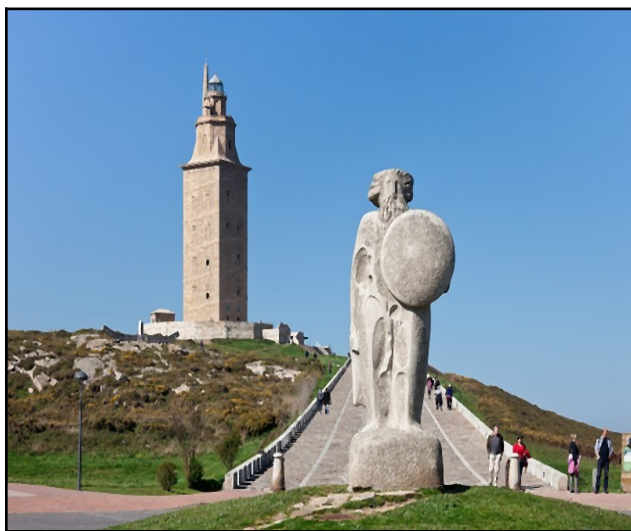
Breogán y la Torre de Hércules, Bugallo Sánchez, L. Disponible en Internet: https://commons.wikimedia.org/wiki/File:Torre_de_H%C3%A9rcules_-_DivesGallaecia2012-62.jpg .