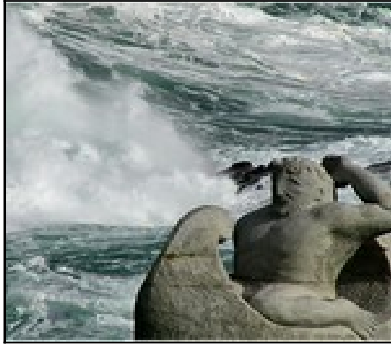
Hércules en la nave de los Argonautas-Parque da torre (Coruña).