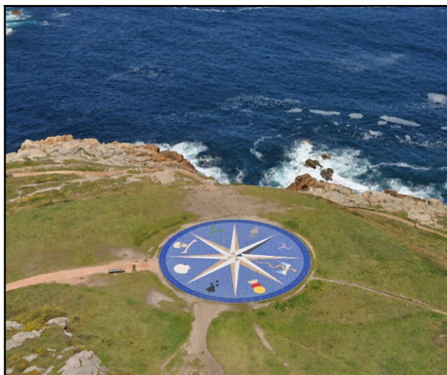
La Rosa de los vientos en el parque de la Torre de Hércules (La Coruña, Galicia, España).