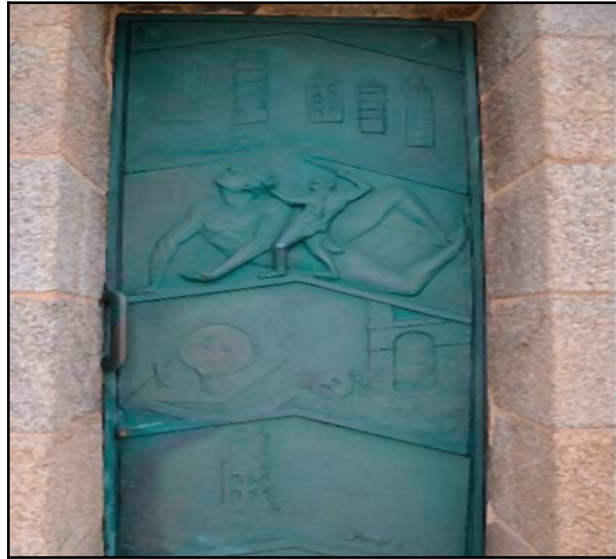
Puertas Torre Hércules. Disponible en Internet: https://quehacerencoruna.blogspot.com/2021/02/puertas-de-la-torre-de-hercules.html .