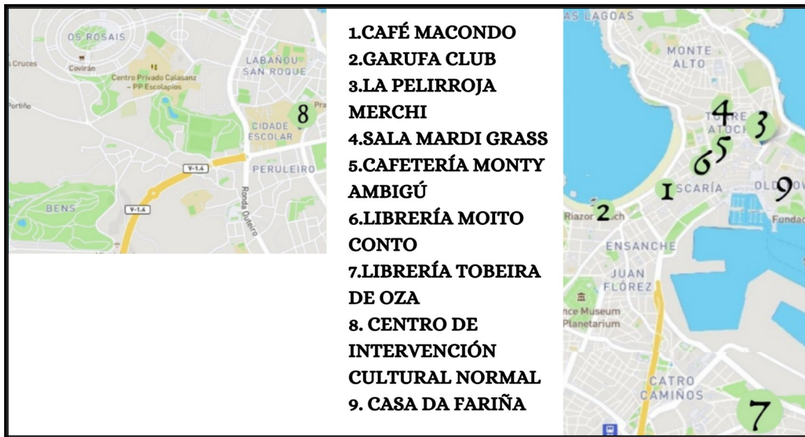
2. Plano que muestra la situación de los locales indicados. Disponible en Internet:

Se trata de algunos ejemplos, más o menos conocidos, que tienen en común que dependen de su clientela habitual o de sus propios espacios virtuales para darse a conocer. Situar los eventos en una misma plataforma sería una facilidad para la ciudadanía, que podría controlar la oferta completa sin necesidad de conocer o buscar específicamente cada local, y para los agentes, que podrían ampliar su público. A continuación, se muestra la situación de los locales, indicados en el plano de la ciudad: