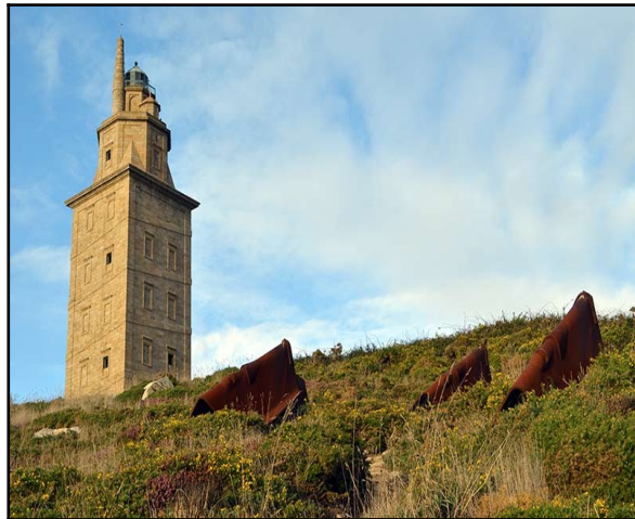
Los Guardianes. Disponible en Internet: https://quehacerencoruna.blogspot.com/2021/02/los-guardianes.html .

A lo largo de todo el Campo Escultórico puedes descubrir obras que hacen referencia al combate entre Hércules y Gerión. En la colina que sube hasta la Torre podemos encontrar los Guardianes, de Soledad Penalta, la escultura representa las tres cabezas del gigante Gerión, siempre vigilando la Torre de Hércules. A los pies del faro están las Puertas, creadas por Francisco Leiro, en las que podemos ver grabada la calavera del gigante y, si subes a lo alto de la Torre, distinguirás un estanque junto al paseo marítimo. Si pasas al lado puede que no lo distingas, pero desde las alturas verás que representa el combate entre Hércules y Gerión; es una obra creada por Tim Behrens y Xosé Espona 171 .