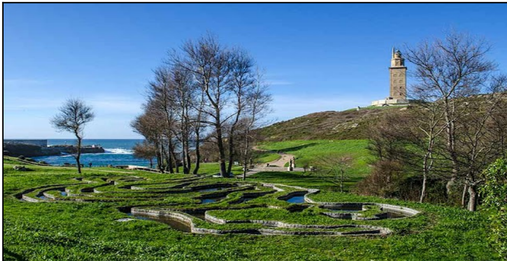
Combate Hércules y Gerión. Disponible en Internet: https://quehacerencoruna.blogspot.com/2021/02/combate-entre-hercules-y-gerion.html .