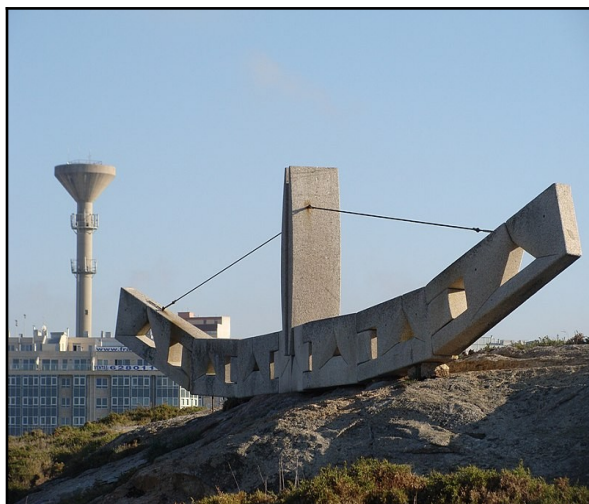
Escultura Hidra de Lerna, de Fidel Goás Mendes, Losada Rodríguez, F.. Disponible en Internet: https://commons.wikimedia.org/wiki/File:Hidra_de_Lerna_(escultura).001_-_A_Coru%C3%B1a.jpg .

También encontrarás muchas esculturas que nos cuentan historias sobre las aventuras de Hércules y sobre sus doce trabajos. Uno de ellos fue derrotar a la hidra, una serpiente de muchas cabezas que volvían a crecer cada vez que las cortaban; gracias al artista Fidel Goás Mendes, el Campo Escultórico tiene su propia Hidra de Lerna. Podrás encontrarla subiendo hacia la Torre, esta es totalmente inofensiva, trátala bien. Hay muchas más leyendas ocultas en el Campo Escultórico. Podrás encontrar a los argonautas, una tripulación de héroes de la antigua Grecia; a Caronte, el barquero que llevaba las almas de los muertos hasta el más allá. ¿Crees que puedes encontrarlas todas 172 ? Te animo a intentarlo.