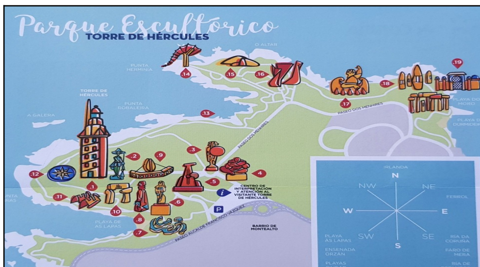
Plano del campo escultórico. Disponible en la sección de Documentos de la página web de Turismo da Coruña: https://www.turismocoruna.com/media/documentos/Parque%20escultorico%20ESP_web2019.pdf .

si quieres acercarte a descubrir sus secretos, puedes hacerlo siguiendo alguna de estas tres rutas: la de la Torre, la de Punta Herminia y la de los Menhires. Están señalizadas y encontrarás paneles informativos en todas ellas. Algunas partes de estos caminos están hechos de tierra y no son accesibles. Si tú o la persona que te acompaña no podéis seguirlos, no te preocupes. El paseo marítimo bordea todo el Campo Escultórico, seguro que podrás ver muchas de las esculturas desde allí.