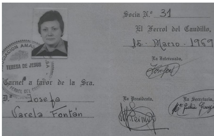
Documento de socia da Asociación de Amas de Casa de Fina Varela. Fonte: reproducido en: Loureiro, 2019: 91