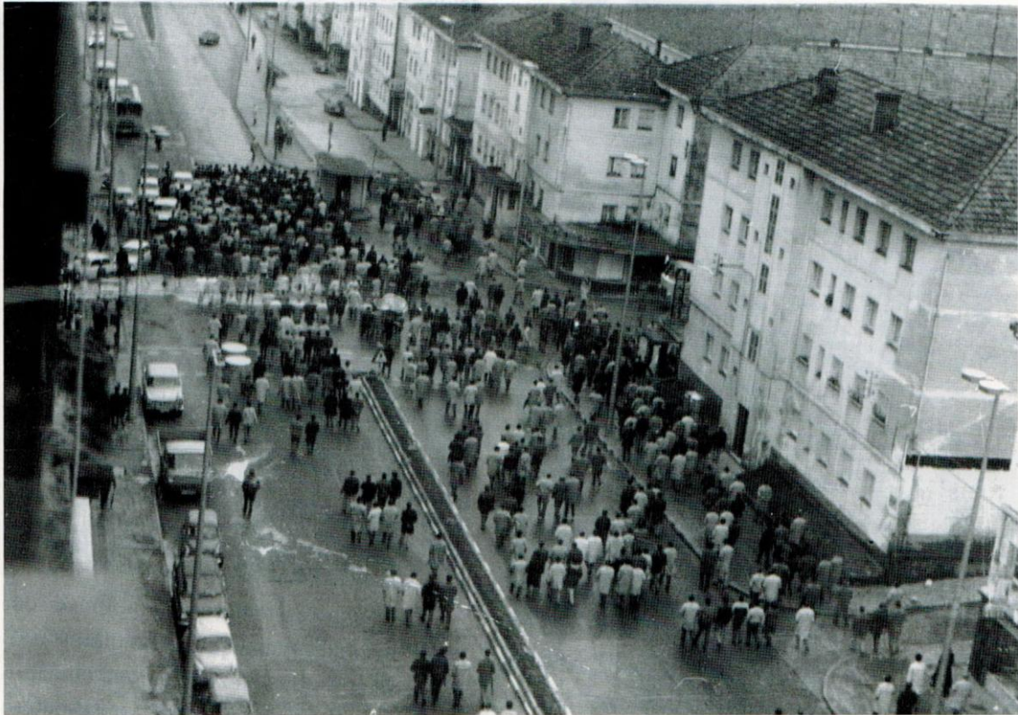
Mítica fotografía tomada por Abel López o 10 de marzo de 1972. Fonte: Arquivo fotográfico da fundación 10 de Marzo. En: https://arquivosdegalicia.xunta.gal/es/sistema-archivos-galicia/archivos-de-galicia/arquivo-historico-da-fundacion-10-de-marzo