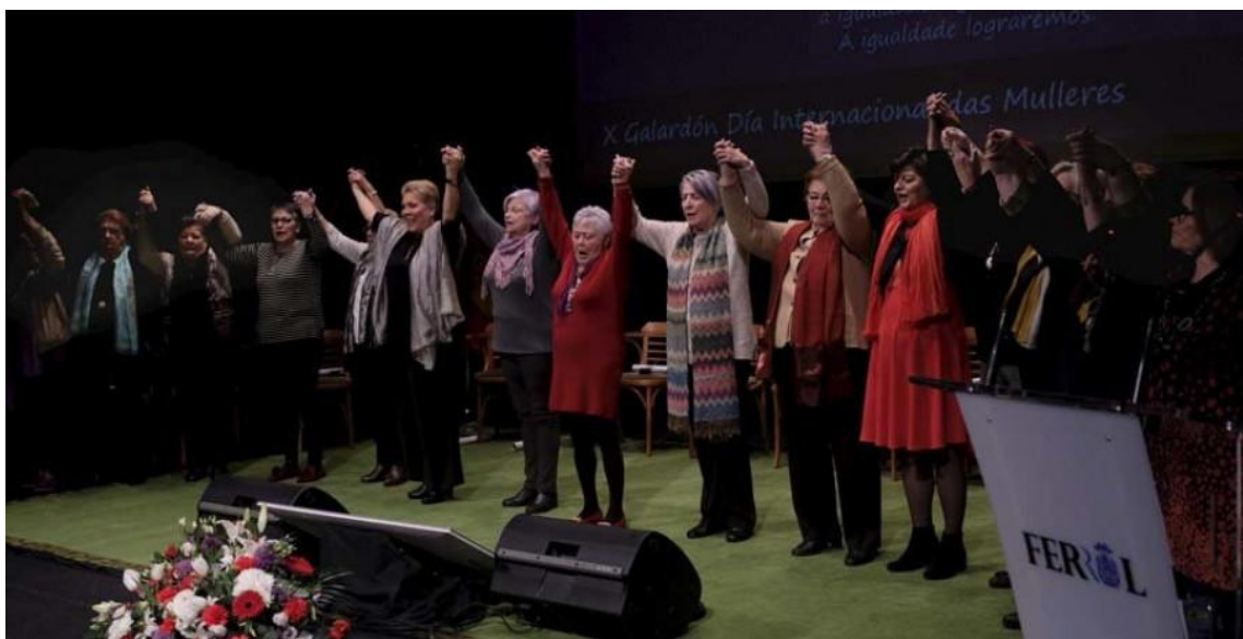
Fotografía no Acto de Homenaxe ás Mulleres do 72 realizado no Teatro Jofre, Ferrol (7 de marzo de 2018).