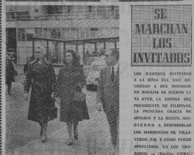
SE MARCHAN LOS INVITADOS

LOS ILUSTRES INVITADOS A LA BODA DEL AÑO, REGRESAN A SUS HOGARES EN BARAJAS SE BUENOS CIEN AYER. LA ESPOSA DEL PRESIDENTE DE FILIPINAS, LA PRINCESA GRACIA DE MONACO Y LA SEGUNDA ACUDIERON A DESPEDIRSE. LOS MARQUÉS DE VILLAVIEJA Y TAL Y COMO PUEDE APRECIARSE EN LOS GRABADOS.