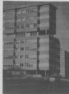
A sombra de Caranza valóranse as forzas políticas