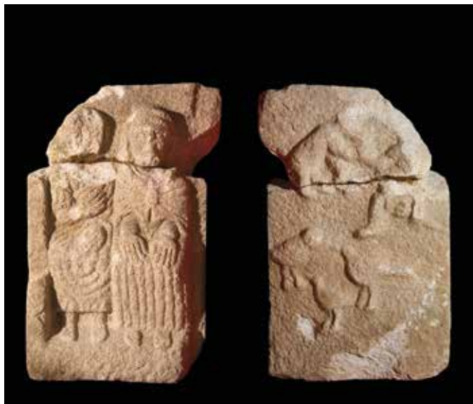
Estela de Adai S. IV d. C. Granito / 91,5 x 58 cm Museo Provincial de Lugo