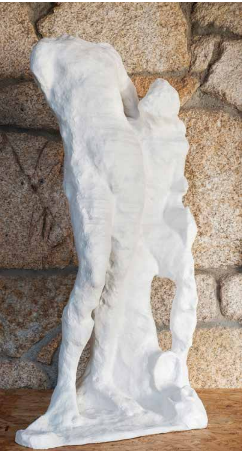
Dionisio e Ampelo (réplica) 93 x 62 x 41 cm Museo Mercedario Verín