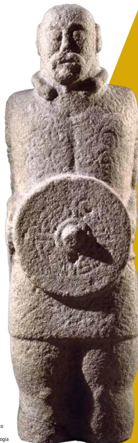
Estatua de Guerreiro Galaico Granito / 173 x 54 x 30 cm Museu Nacional de Arqueologia Lisboa, Portugal

Por suerte, el avance en la investigación arqueológica está abriendo pequeñas ventanas a través de las cuales podemos acercarnos a un pasado enormemente diverso, no carente de complejidad y, sin duda, fascinante. Al igual que no hay un castro igual que otro, aunque se parezcan mucho entre sí, tampoco sus habitantes pueden etiquetarse de forma conjunta. Los romanos reconocieron las similitudes existentes entre los indígenas, pero también supieron percibir las diferencias y aprovecharlas en su beneficio. Documentos excepcionales como el Edicto del Bierzo (15 a. C.) revelan claramente que hubo quienes se opusieron a los romanos y quienes optaron por colaborar con ellos. Sin duda, existieron muchas gamas de grises entre el blanco y el negro. Por otro lado, la ingente cantidad de campamentos militares que están apareciendo en nuestro territorio -gracias a la incorporación de nuevas tecnologías y métodos de investigación arqueológica- es indicativo de que la anexión, el control y la explotación de esta zona en los primeros tiempos no debió de ser tarea fácil y habría exigido un gran esfuerzo operativo.