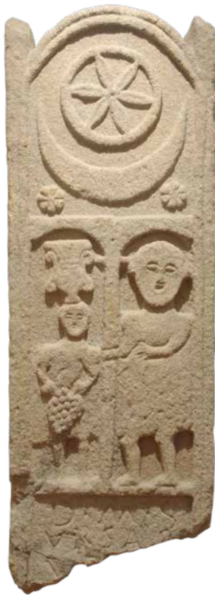
Estela funeraria de Vigo Dionisio e Ampelo S. II-III d. C. Granito / 196 x 59 x 19 cm Museo Municipal de Vigo "Quiñones de León"