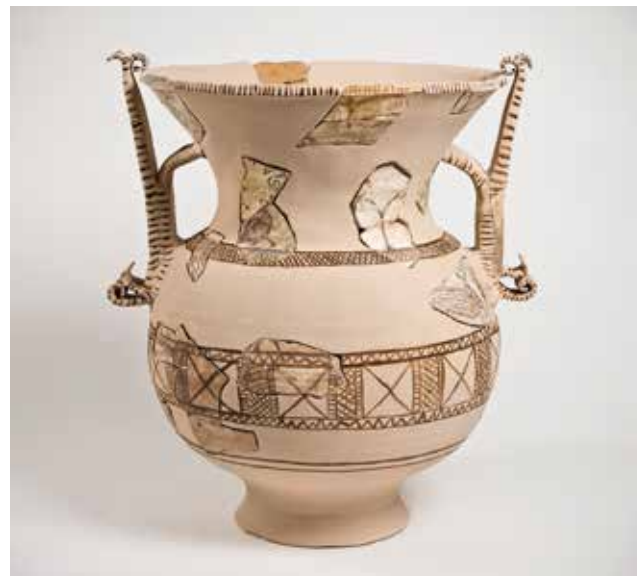
Crátera de Toralla S. III-IV d. C. Arxila | Arcilla / 56 x 44 cm Museo Municipal de Vigo "Quiñones de León"

alusións ás tribos, pobos e castros de procedencia. As nomenclaturas e titulacións ao gusto romano van en aumento. Igualmente fascinante é a enorme diversidade apreciable na plástica escultórica destes monumentos. Algunhas solucións son máis arcaizantes, esquemáticas, pero están dotadas dunha expresividade crúa e penetrante que nos traslada a un máis alá perdido na néboa dos tempos. Outras son manifestacións canónicas dentro da estética clasicista, dificilmente distinguibles de pezas aparecidas no sur de Francia, Italia ou o norte de África. Dalgún xeito, a Gallaecia vai collendo forma propia nun mundo interconectado. Con asombrosa naturalidade exprésase dentro dun ecosistema que permite manifestacións que hoxe definimos como glocalizadas.