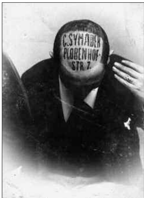
Fig. 7. Imagen del circo.