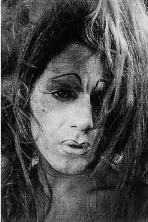
Fig. 16. Lucas Samaras, Auto polaroids , 1969-71.