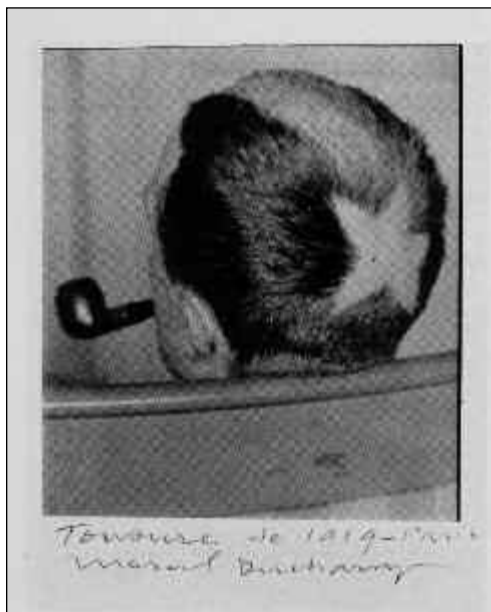
Fig. 6. Marcel Duchamp, Tonsura , 1919.