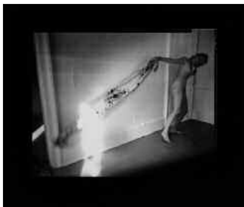
Fig. 15. Francesca Woodman, S.T. , Nueva York, 1979.