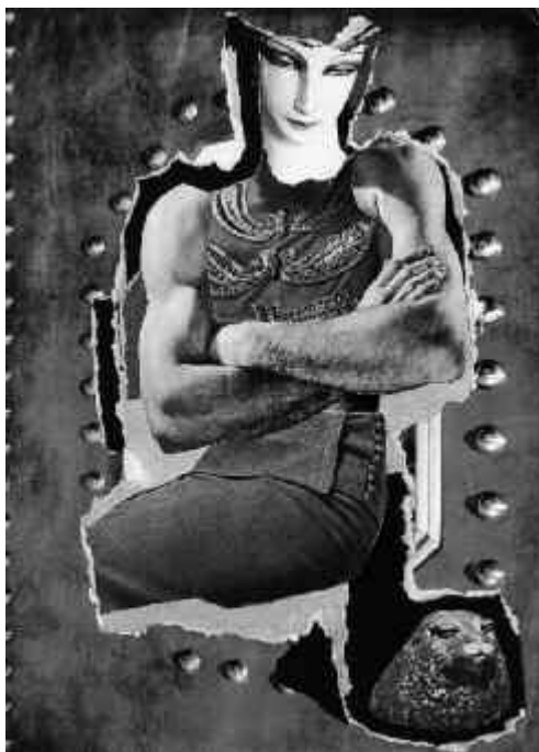
Fig. 8. Hannah Höch, Domadora , ca. 1930.