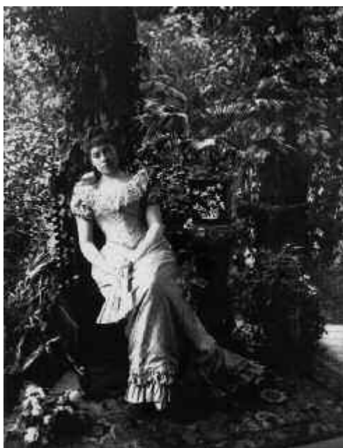
Fig. 3. Alice Austen, Autorretrato . De cuerpo entero y abanicado. Lunes, 9 de septiembre de 1891, 1891.

Algo semejante ocurre con la película de Tod Browning estrenada en 1932, al menos en cuanto a paradojas se refiere. A pesar de las muchas críticas recibidas por haber usado para la producción personas con auténticas diferencias físicas en un momento en que las célebres barracas habían sido erradicadas al menos en teoría, el director reflexiona sobre un concepto básico a través del relato: lo “normal” no es sino una construcción y en el mundo de los “freaks” la extraña, la discordante, es la bella trapecista