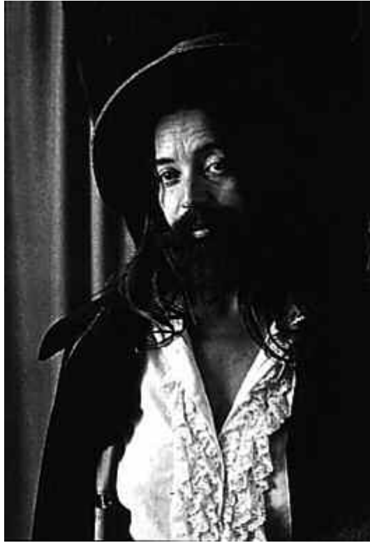
Fig. 18. Eleanor Antin, Portrait of the King , 1972.

sino recoger la tradición de las mujeres que se replantean lo femenino desde sus mismas raíces, reflejada en los varios estereotipos americanos que aborda.