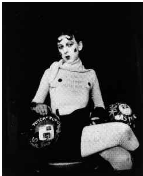
Fig. 5. Claude Cahun, Autorretrato , ca. 1927.