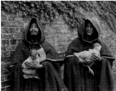
Fig. 1. Ulrike Ottinger, Freak Orlando , 1981.