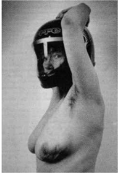
Fig. 12. Hannah Wilke, 16 de junio de 1992/19 de febrero de 1992, núm. 1, de la serie Intra Venus, 1992-93.

complejo de autorización. Por tanto la pregunta canónica '¿Qué es la verdad?' no se puede separar del proceso de verificación de esa verdad" 14 .