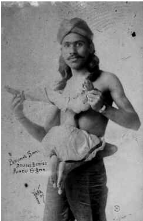
Fig. 2. Imagen del circo.

La Londres de Jarman, un caos de fábricas abandonadas, indigentes, fogaratas, montones de basura, edificios en decadencia..., propone un siniestro escenario para el mundo al revés. En medio de una ciudad en guerra y asaltada por la necesidad de abandonar un hogar que no es ya acogedor ni seguro, el cineasta británico plantea cierta narración donde el terror proviene del stablishment . Quizás por este motivo el último fotograma de la película, de una intensidad dramática inusitada, muestra la huida en una barca de siete figuras con ropas claras y regusto teatral, evocando una epopeya mítica. Abandonan la ciudad, devorada por las llamas, y se van guiados por una luz que —ahí radica la paradoja— los hace diana fácil.