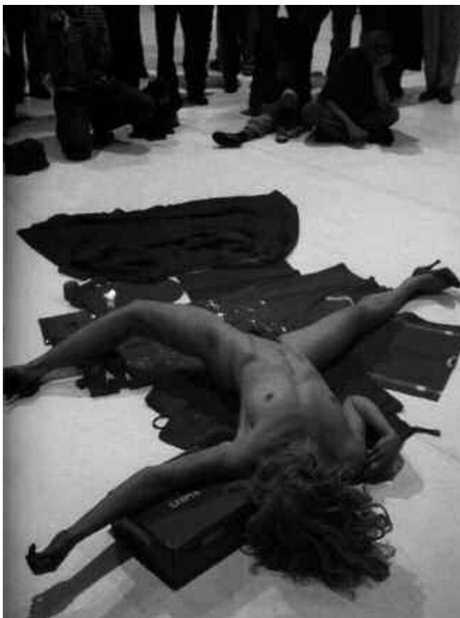
Fig. 13. Ribot, Pieza distinguida 27 (Another Bloody Mary) , 2000.