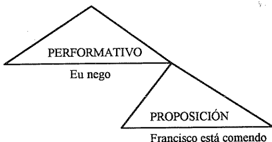
Fig. 2. Análise da oración "Francisco está comendo" segundo Antinucci-Volterra.

Antinucci e Volterra (1975) propoñen un estudio pragmático da negación, partindo do modelo semántico-xenerativo de Parisi e Antinucci (1971), pero incorporando á análise semántica fenómenos de tipo pragmático, como o performativo. No modelo de Antinucci-Volterra represéntase o significado dun enunciado en dous compoñentes: o performativo, que representa o tipo de acto ilocucionario e especifica a intención comunicativa do falante; e a proposición que especifica o contido do acto (Figura 2).