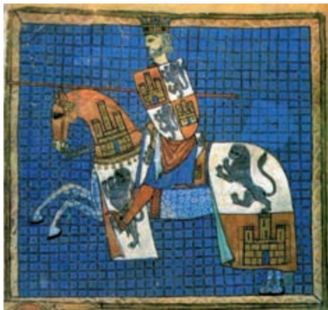
Tombo A , Arquivo-Biblioteca da Catedral de Santiago

— Este libro foi impreso no ano xacobeo de 2021, para conmemorar o oitavo centenario do nacemento de Afonso X