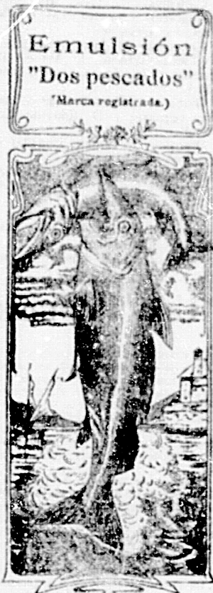
Emulsión "Dos pescados" (Marca registrada.)

Nos referimos a una nueva y excelente preparación de Emulsión «DOS PESCADOS» (marca registrada) la que contiene todas, las extranjeras y españolas, tanto en calidad como en precio. Depositarios: por menor, Farmacia y Laboratorio de Iglesias. Por mayor, Droguería de Iglesias y compañía.