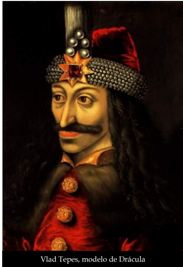
Vlad Tepes, modelo de Drácula

La representación del vampiro en la época contemporánea es la adaptación del personaje Conde Drácula de la novela de Stoker publicada en 1897. Los vampiros fueron humanos, pero ahora están en un estado intermedio entre la vida y la muerte, de ahí que se les llame no-muertos, revivientes o redivivos. Esta