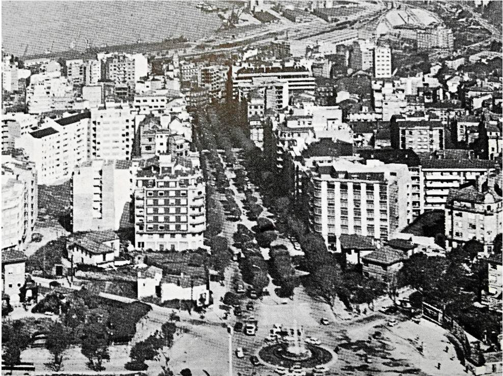
Fig. 3. Vista general de la Gran Vía en los años 70