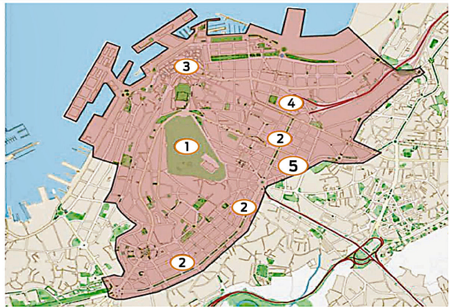
Fig. 4. Áreas urbanas seleccionadas para el proyecto Vigo Vertical