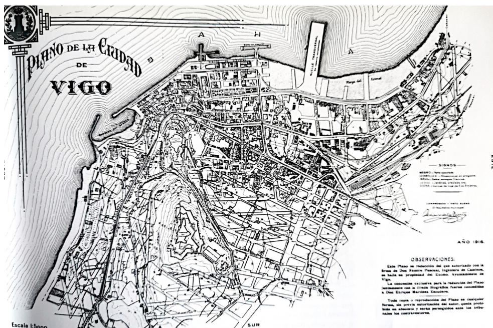
Fig. 1. Plano de Proyecto de Reforma y Ensanche de Vigo de Ramiro Pascual, 1907