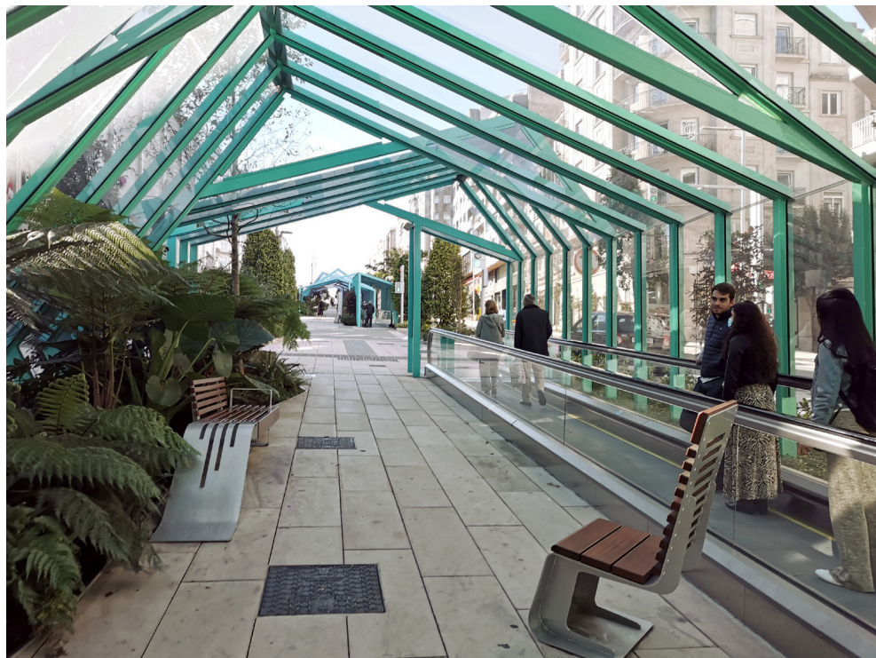
Fig. 6. Detalle del interior de las rampas