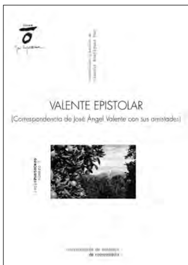
Cuberta de Valente epistolar , edición de Claudio Rodríguez Fer