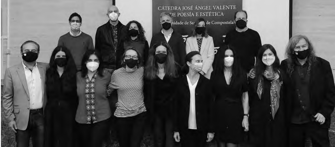
Participantes no encontro sobre Valente epistolar de 2021

París. A partir de aí, os autores comezan a escribirse, inda que a súa comunicación foi maiormente telefónica. Ambos influíronse mutuamente, como proba a presenza dunha trintena de libros de Jabès na biblioteca de Valente e incluso a existencia dun dossier sobre Jabès no arquivo do mesmo poeta, tamén conservado na Cátedra. Non obstante, non foi Valente o único preocupado en que a obra de Jabès se difundira, concretamente en España, pois, reciprocamente, Jabès preocupouse por dar a coñecer a Valente en Francia.