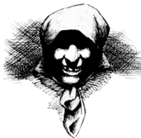
Fig. 2. “Pano de moza”: debuxo de Xurxo Lourenzo (Acuña 2005: 180).