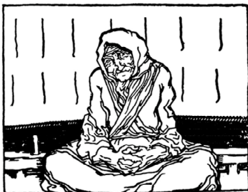
Fig. 1. A Siña Sinforosa (Castelao 2005; ed. or. 1926: 45).

amores de vellos hainas tamén ben trágicas: “a vella perdeu o vello / antre a follíña do millo, / anda agora preguntando / polo seu agarimiño (Cabanillas 1983: 162). Porque a traxedia sempre asexá, en múltiples formas, ós que teñen máis idade.