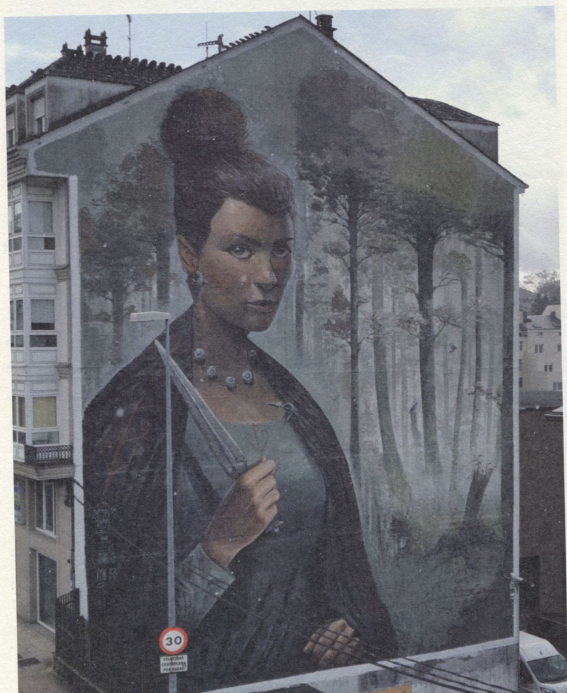
Fig. 3. YOE 33: copora ou A castrexa , 2023. Rolda da Muralla, 158. Fotografía de Begoña Fernández, marzo de 2024

O Concello apostou de forma aberta e directa polas expresións de muralismo e arte urbana, favorecendo a creación, para o embelecemento da cidade, pero tamén como vía para enxalzar valores, ideas e colectivos (Méndez, 2023). Obras que, en ocasións, veñen instaladas en zonas que contan con afectacións patrimoniais ou en espazos moi próximos a bens culturais, terreo que sempre resulta conflictivo dende o punto de vista da xestión do patrimonio cultural, xa que coa súa presenza xeran novos puntos de vista e inciden nas visuais do monumento.