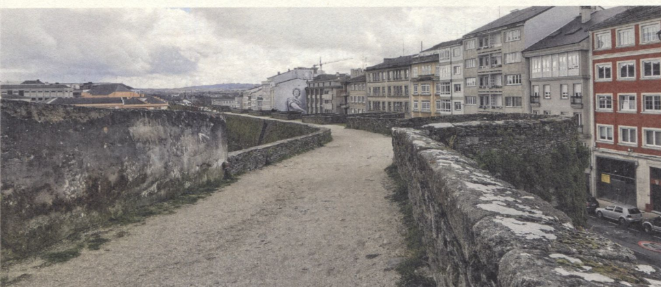
Fig. 5. vista dende a muralla do mural xulio César.