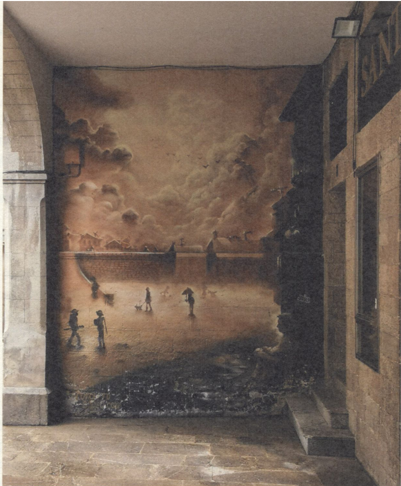
Fig. 1. mural de concepto circo. rúa de bon xesús de Lugo. Fotografía de Begoña Fernández, marzo de 2024

que atraen os viandantes e tenden a potenciar a identificación dos cidadáns coa obra ou obras, ao tempo que xeran a sensación dun espazo coidado e a súa consecuenta mellora ambiental. Son estes aspectos, todos eles positivos, os que provocaron que a meirande parte das cidades españolas se fagan eco destas iniciativas para mellorar ou proxectar, por medios plásticos, a reforma dos diferentes espazos urbanos, conseguindo con iso a recuperación de ámbitos que antes presentaban un proceso de degradación.