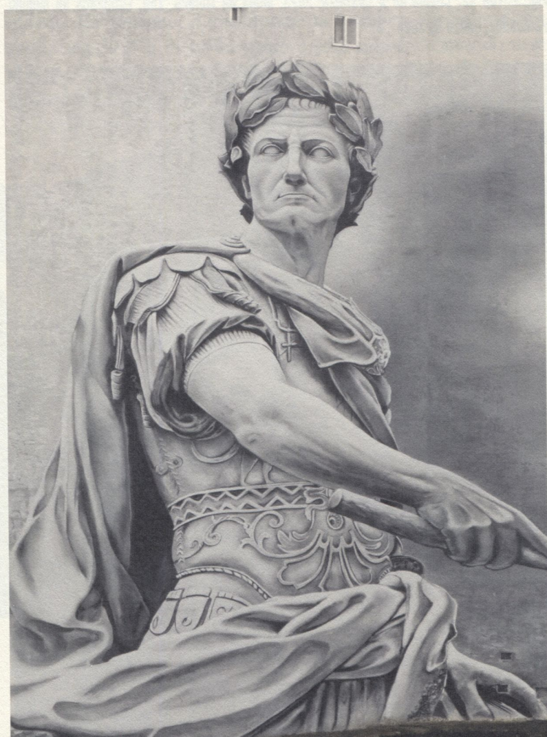
Fig. 2. Diego AS: Xulio César , 2019. Rolda da muralla, 133. Fotografía de Begoña Fernández, marzo de 2024

Esta tendencia reflíctese na cidade de Lugo, cidade na que as ditas manifestacións cobraron un gran protagonismo dende os anos 90; así, o seu espazo urbano conta cun importante número de exemplos, algúns situados incluso nas proximidades do conxunto catedralicio da cidade e, polo tanto, en pleno epicentro do seu conxunto histórico-artístico [Fig. 1], cos que posibilitou a recuperación de moitos dos seus ámbitos públicos, marcados por un