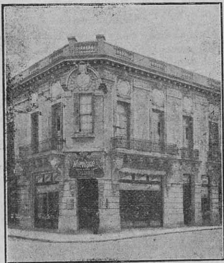
Casa Matriz, Brasil 1301 Sucursal, Alsina 1499

Casas las mejor surtidas en calzado de todas clases y con un selecto stock en novedades y fantasías para la presente estación.