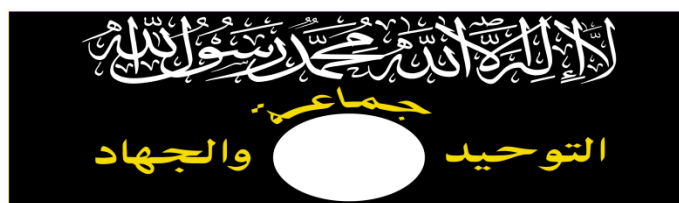
Logo de Tawhid wa al-Jihad