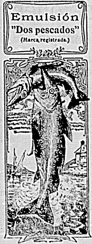
La que en menos tiempo alcanzó más popularidad y estimación de la clase médica y obvia más mellas de oro. Dr. Doyca