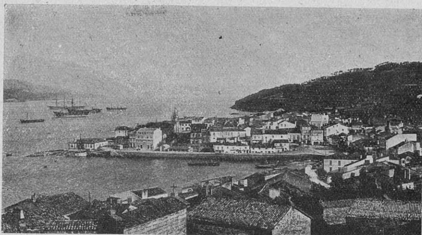
Vista panorámica de la Villa, en años atrás, antes de dar comienzo a la construcción de sus obras de puerto, que ahora la embellecen