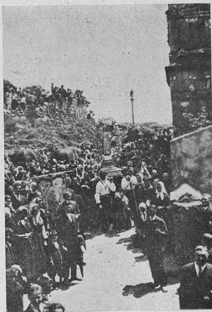
La procesión del Perpetuo Socorro a que se refiere la crónica publicada en la sección respectiva.