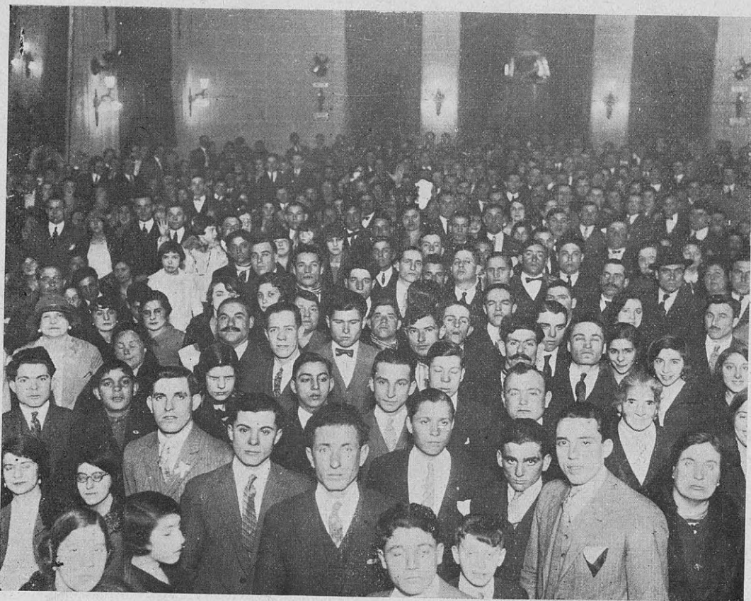
Una parte de los numerosos concurrentes a la velada última

De bote a bote, el amplio salón donde se celebró la velada, resplandecía de magnificencia y en aquel hormiguar incessante de la muchedumbre, ávida de honestas diversiones, sólo se percibía el an-