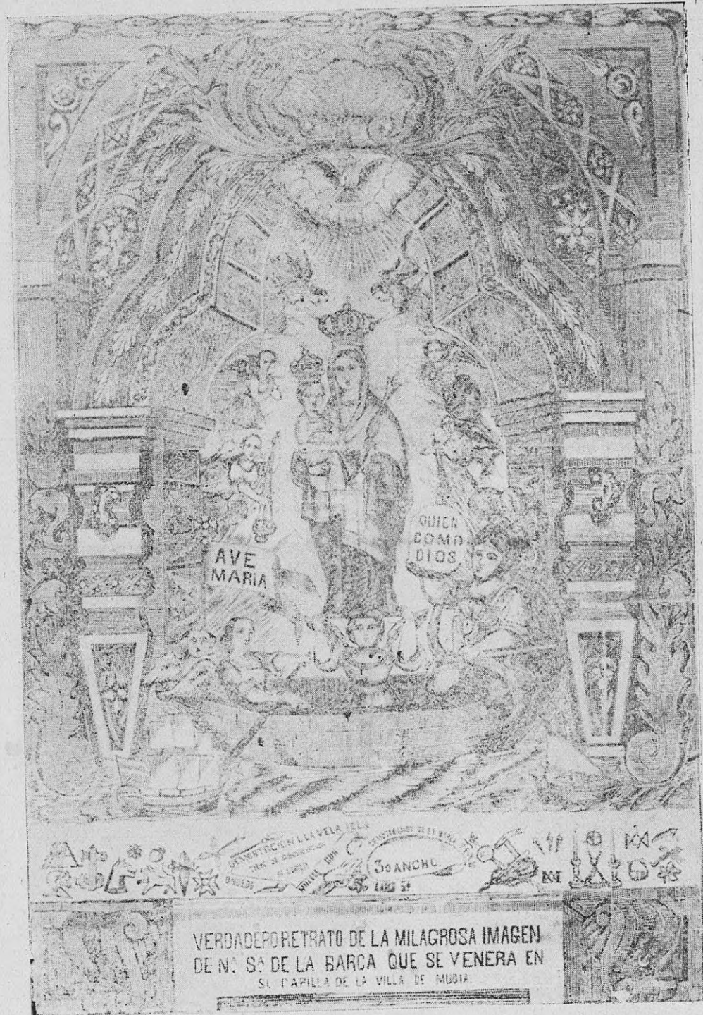
Grabado antiguo de la Virgen de la Barca, en cuyo honor se celebran tradicionales fiestas en este mes