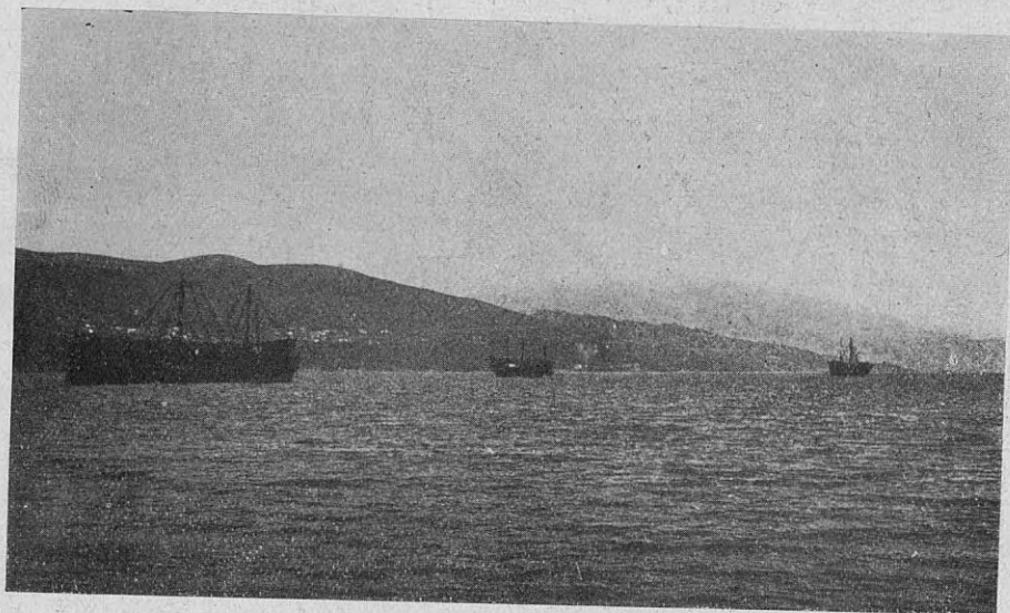
Depósitos flotantes de carbón que surten a muchos de los numerosos vapores que hacen la travesía de Europa y de América

Si a estos factores de que hacemos referencia añadimos el dinero de la emigración, la venta de encajes, industria que, en mayor o menor grado, existe en toda esta zona, bas-